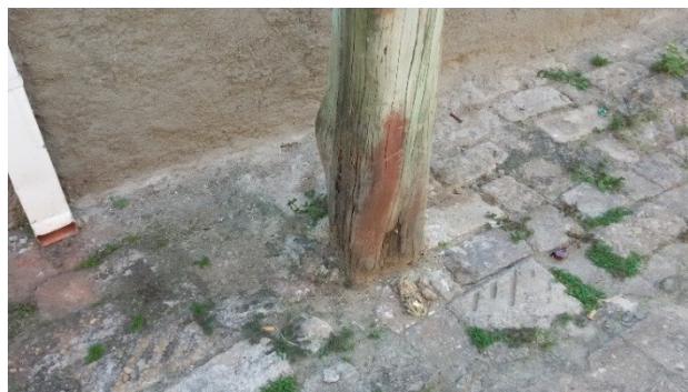
FOTOS: Postes de madeira na Rua Jorge Rodrigues de Araújo, no Jardim Santa Marina, em Jacareí.