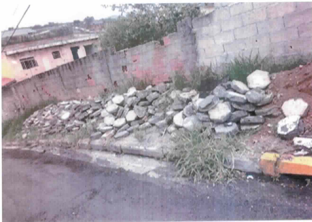
FOTO: Calçada da Rua Norival Soares, na altura do nº 634, no Bairro Cidade Salvador.

Indicação nº 3385/2017 - SÔNIA REGINA GONÇALVES (Sônia Patas da Amizade) - fls. 2/2