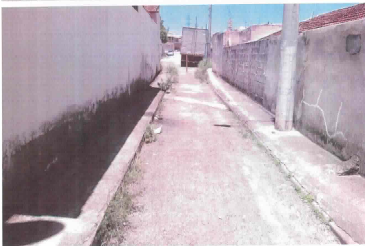
FOTOS: Rua Aparicio Saraiva de Almeida Viana, na Vila Formosa.