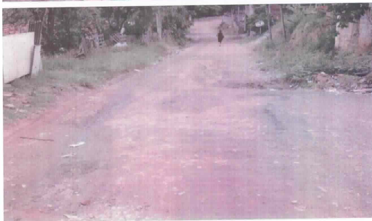
Rua Sergipe, no Bairro Rio Comprido.