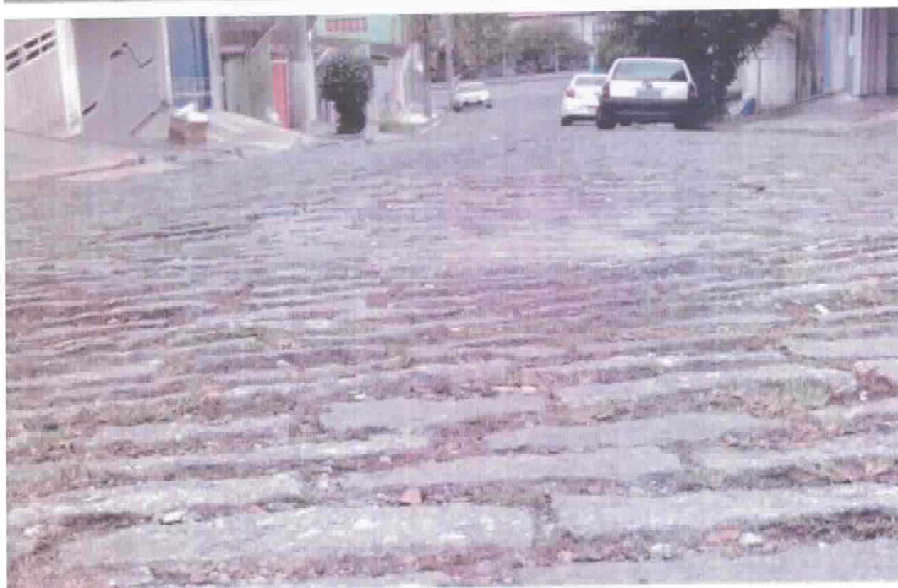
FOTOS: Rua Vista Alegre, na Vila Formosa.