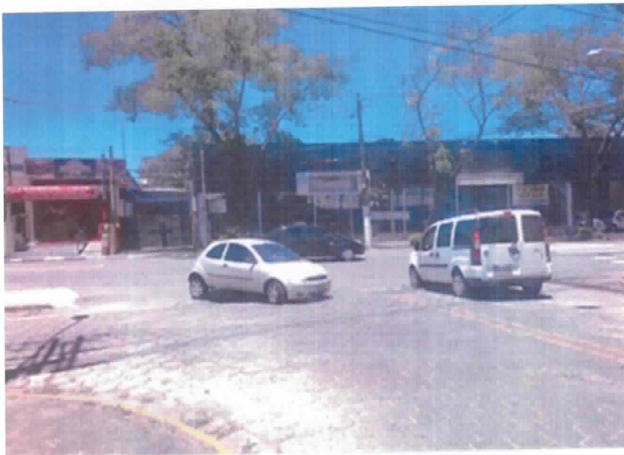
FOTO: Acesso das Ruas Arkansas e Mississippi para a Avenida Pensylvânia, no Jardim Flórida.

Indicação nº 3388/2017 - SÔNIA REGINA GONÇALVES (Sônia Patas da Amizade) - fls. 2/2