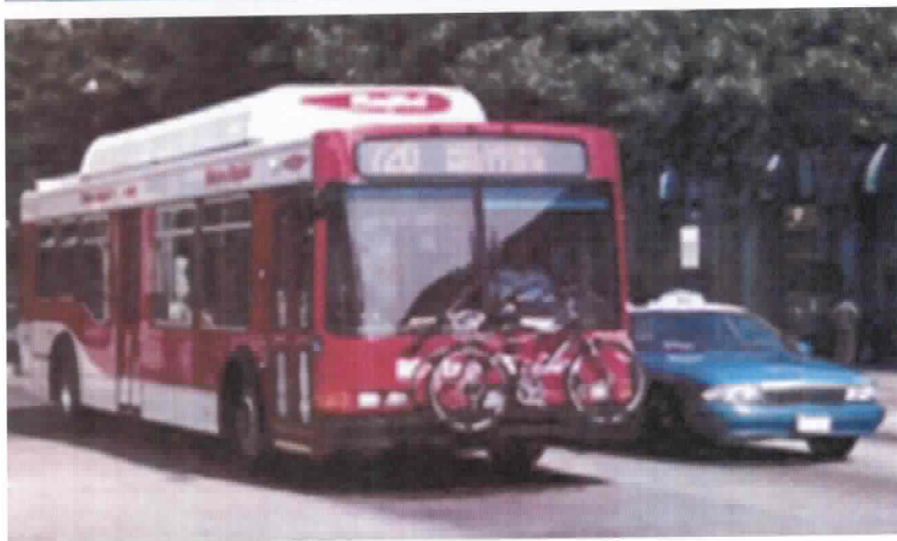
FOTOS ILUSTRATIVAS: Táxi e ônibus adaptados para o transporte de bicicletas.