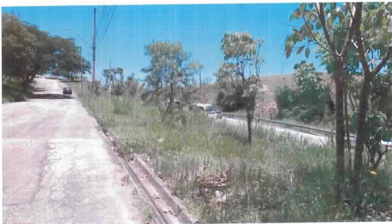
FOTO: Área entre a Av. João Baptista de Sant'Anna e a Rod. Euryale de Jesus Zerbine, no Bairro Bandeira Branca I.