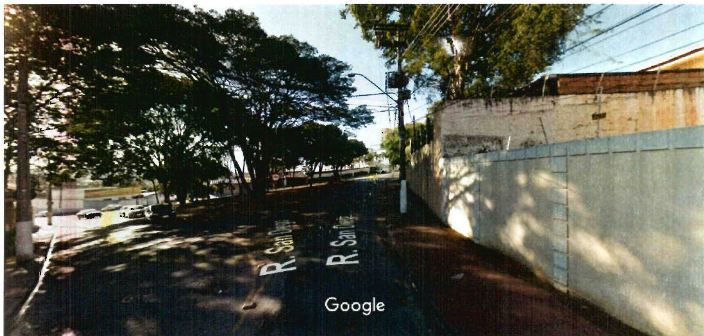
Captura da imagem: ago 2017