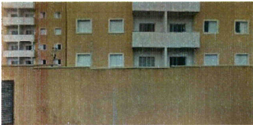
R. San Diego - Jardim California Jacareí - SP