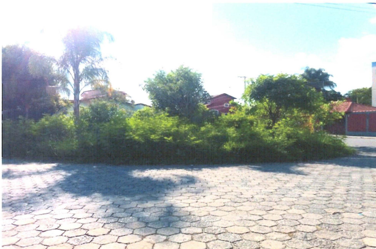
FOTO: Praça localizada na Rua Dimas Vasconcelos Rodrigues, na altura do nº 228, no Jardim Santa Maria.