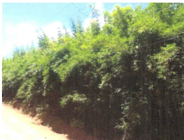
FOTOS: Bambuzal na altura do nº 654 da Estrada Galdino Teodoro de Rezende, no Bairro Estância Porto Velho