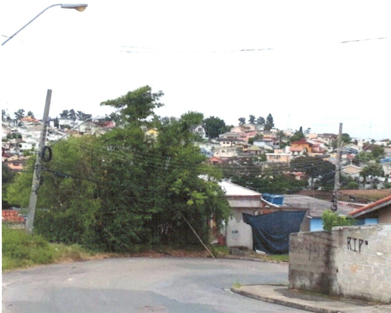
FOTO: Poste na Rua Príncipe Gaston D'Eu, no Parque dos Príncipes, em Jacareí.

Requerimento nº 30/2019 - ARILDO BATISTA - fls. 2/2