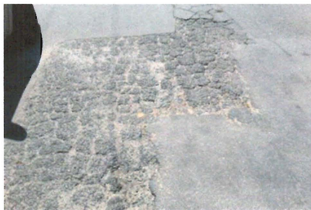
FOTOS: Rua Montese, no Parque Itamaraty.