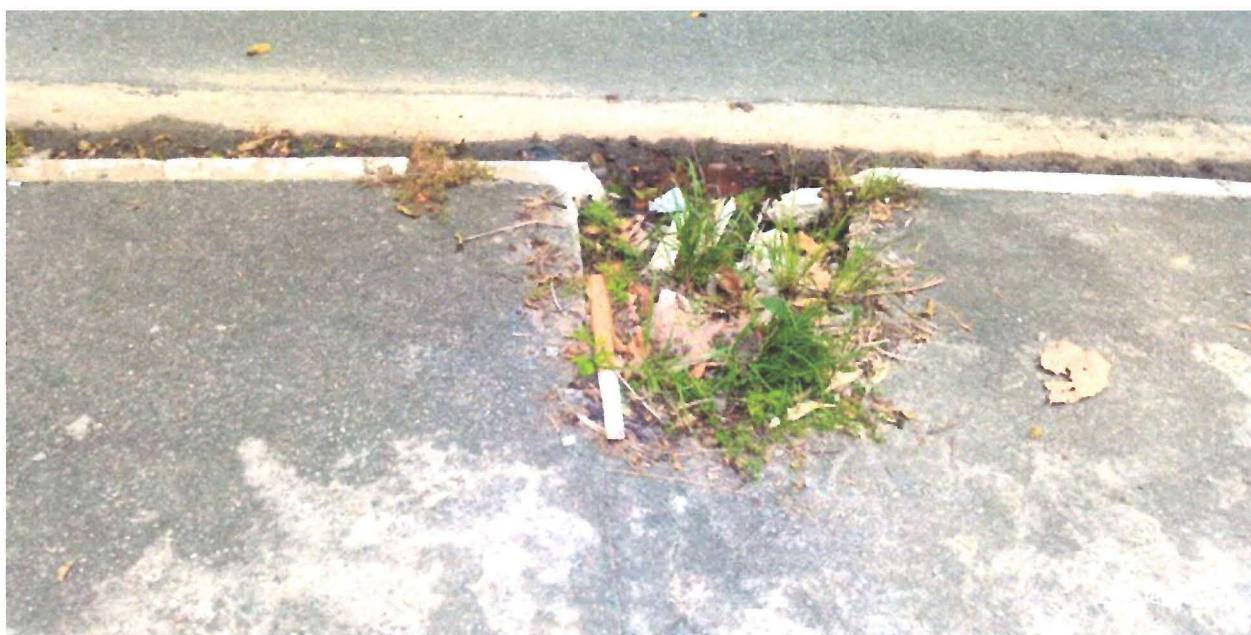
FOTOS: Calçada da Avenida Major Acácio Ferreira, nas proximidades do nº 810, no Jardim Paraíba.