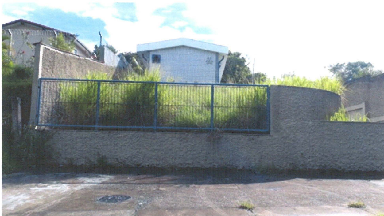
FOTO: Imóvel localizado na Estrada São Silvestre (JCR 105), nº 100, no Distrito de São Silvestre, neste Município.

Requerimento nº 68/2019 - ARILDO BATISTA - fls. 2/2