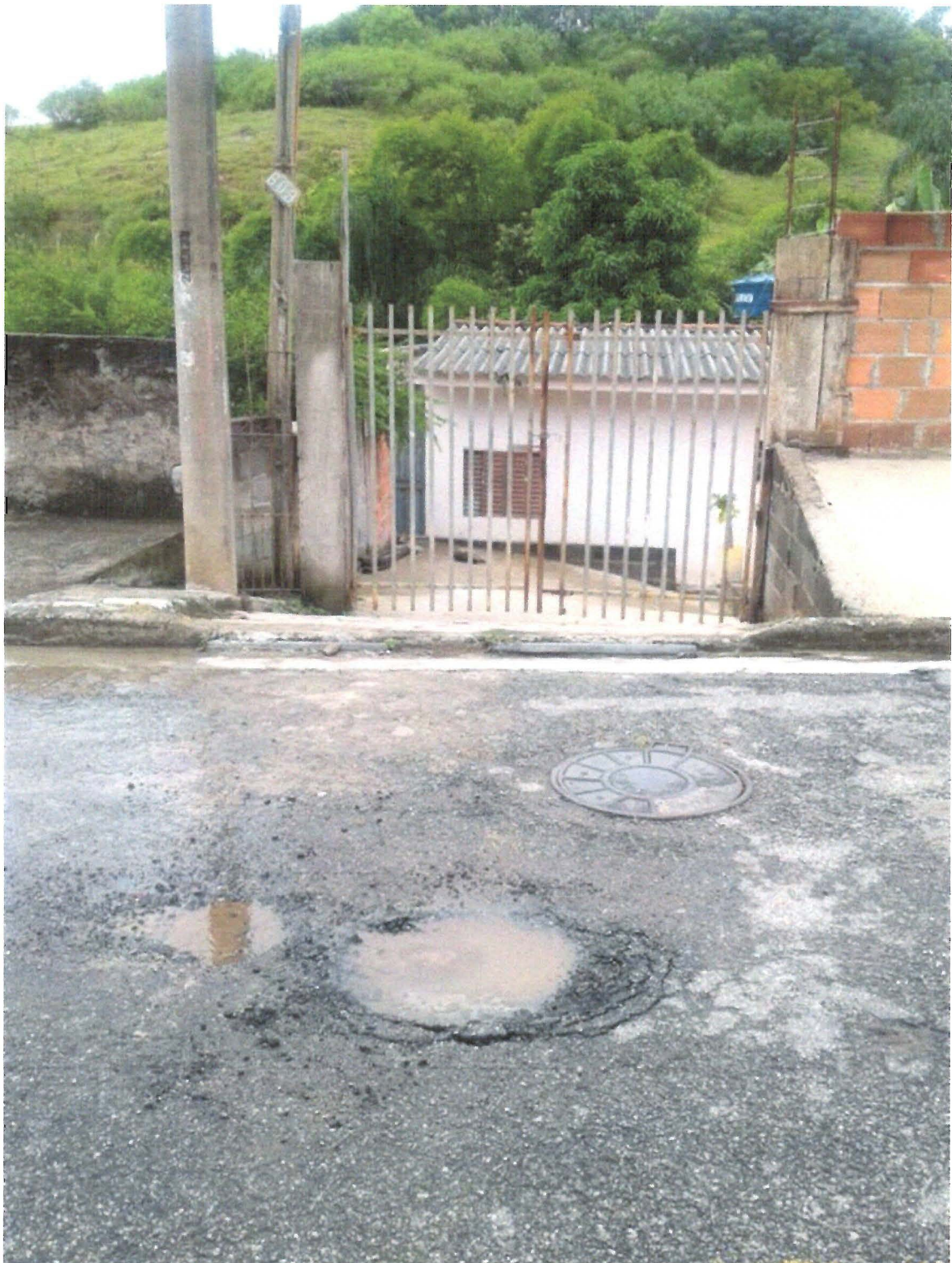
FOTO: Rua Rosalina Guerra de Miranda, defronte do nº 609, no Bairro Cidade Salvador.

Indicação nº 809/2019 - LUÍS FLAVIO (FLAVINHO) - fls. 2/2