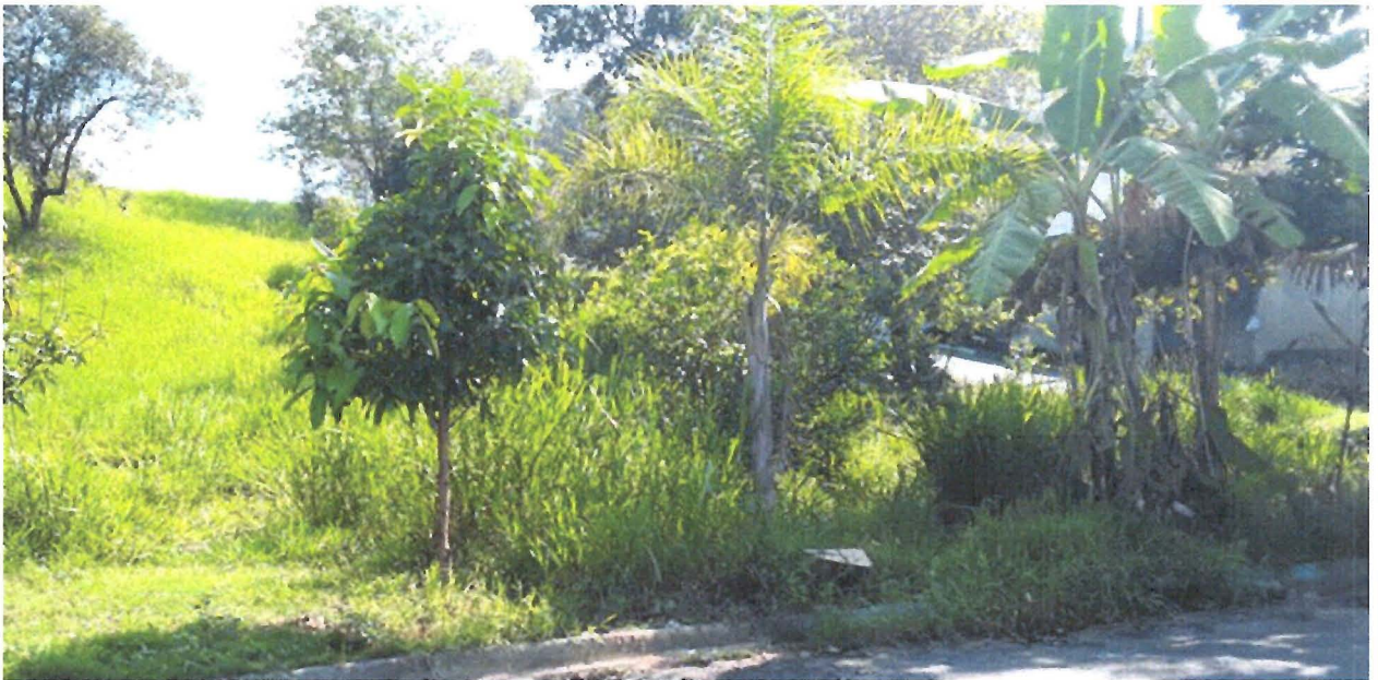
FOTOS: Área pública na Av. Rodrigo Mello Franco Andrade com a R. Miguel Couto, no Jardim Nova Esperança.