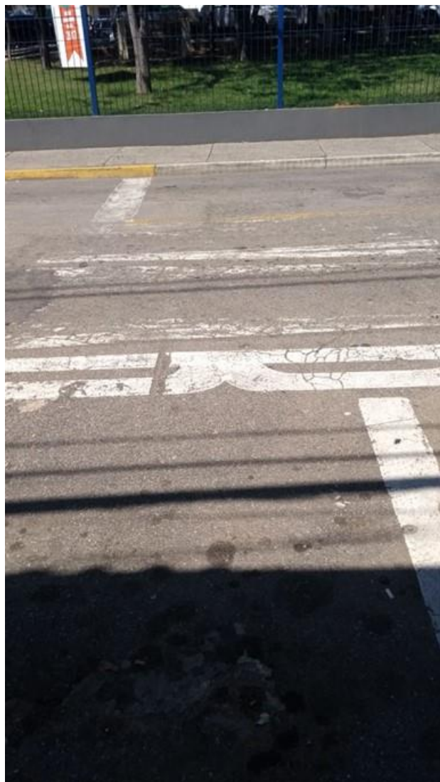
FOTOS: Rua Ernesto Duarte, defronte do Hospital São Francisco, no Parque Califórnia.