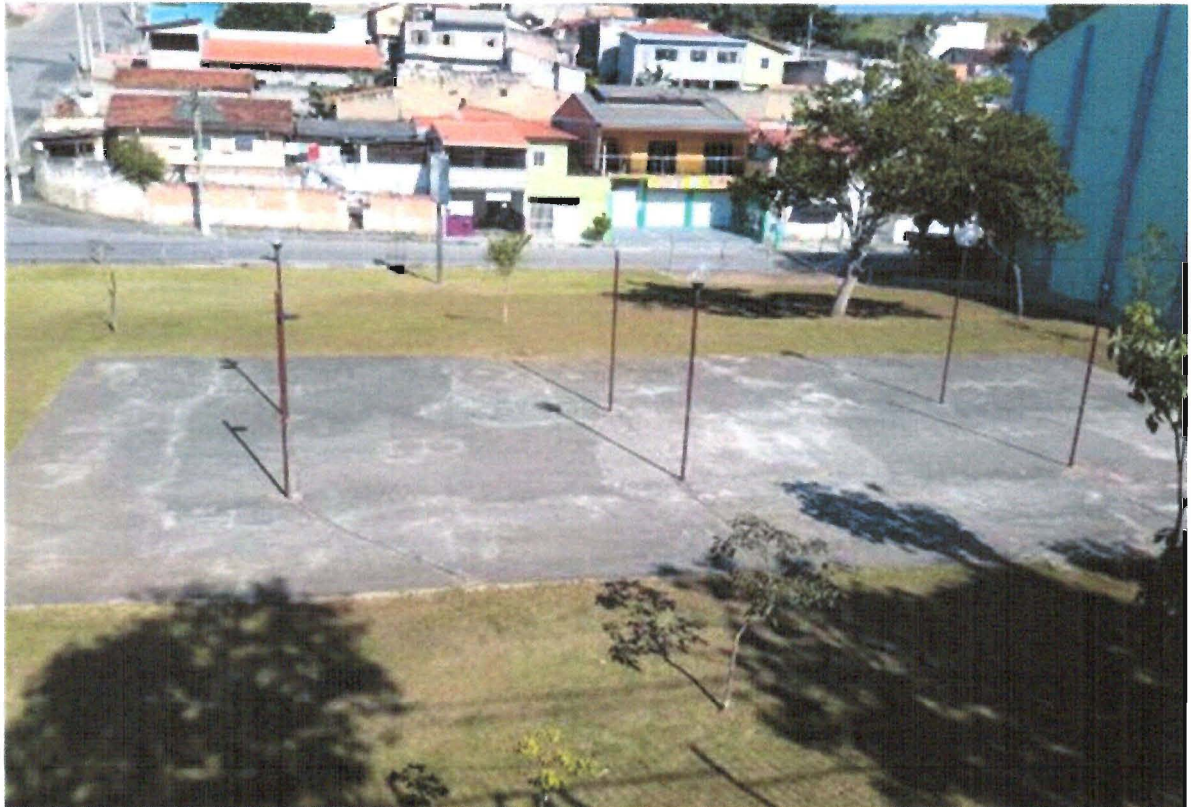
FOTO: Área interna do EducaMais Jardim Paraíso.