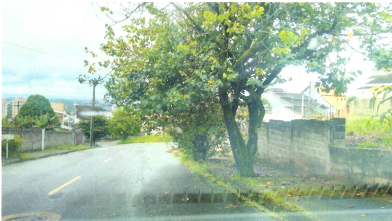
FOTO: Árvore na Rua Ary D'Ávila, no Jardim Terras de São João.