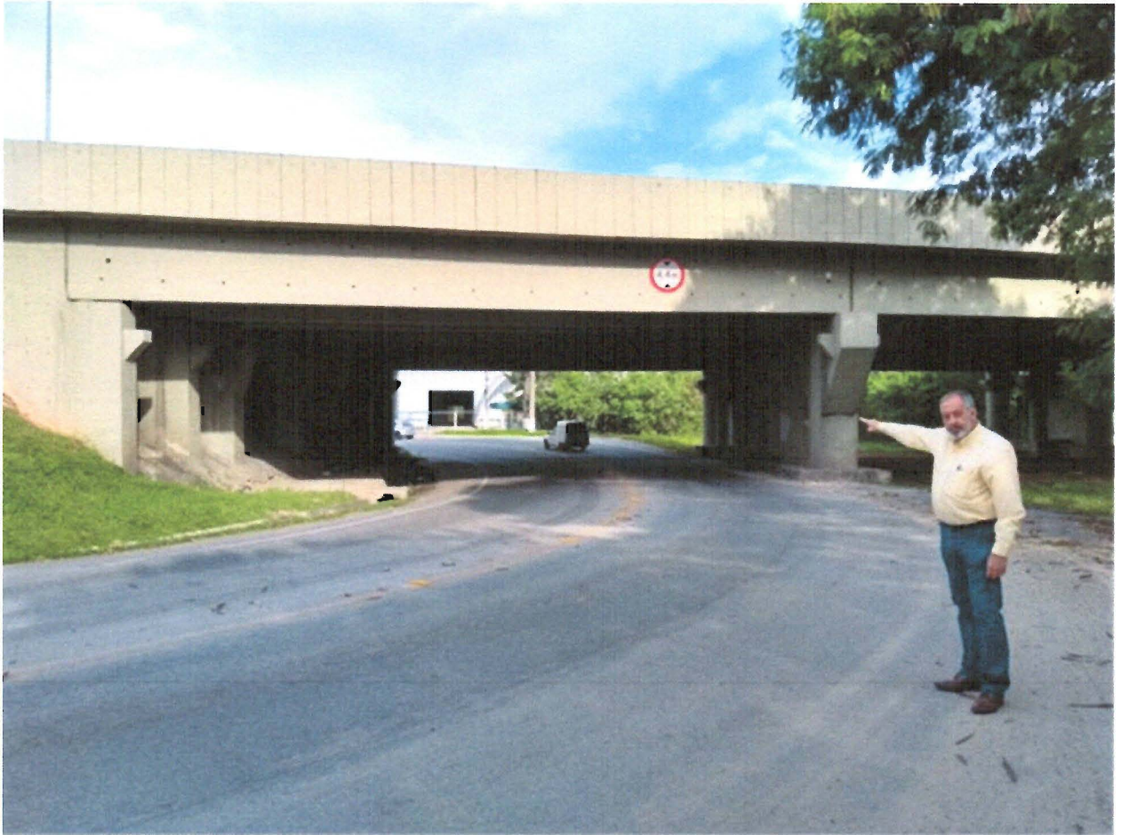
FOTO: Viaduto na altura do km 161 da Rodovia Presidente Dutra, próximo à empresa Basf, em Jacareí.