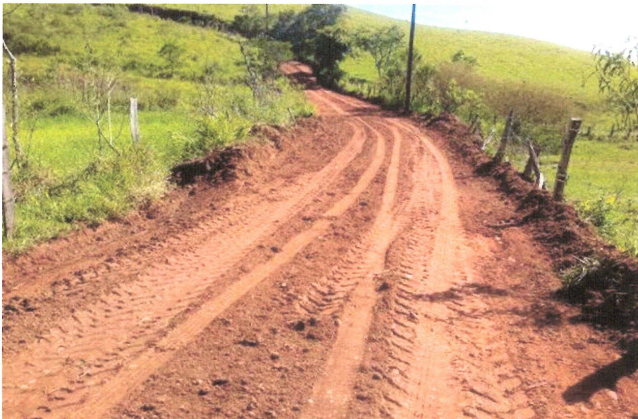
FOTO: Estrada Pindaiúva,, no Jardim Colônia.