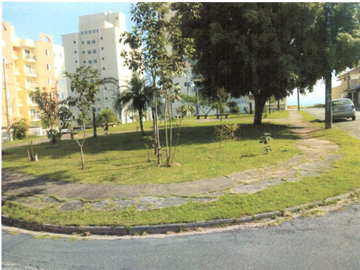
FOTO: Praça José Simplicio, na região de confluência das Ruas Gilberto Moreira e Triunfo, na Vila Aprazível.

Indicação nº 1439/2019 - ARILDO BATISTA - fls. 2/2