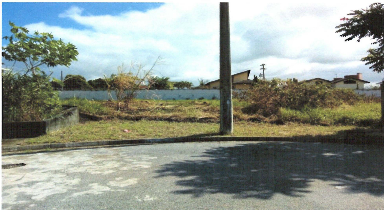
FOTO: Terreno situado no final da Rua Ivair Scavone, ao lado do nº 65, no Jardim Altos de Sant'Anna II.