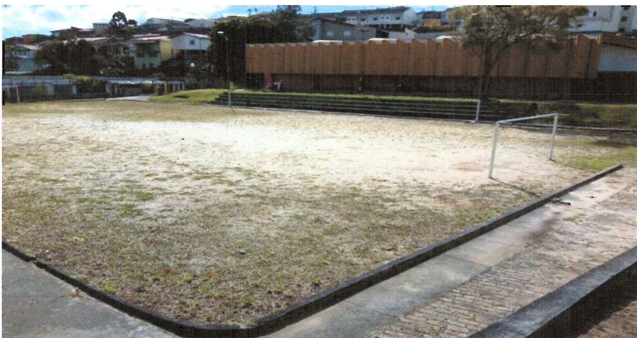
FOTOS: Centro Comunitário da Vila Formosa.