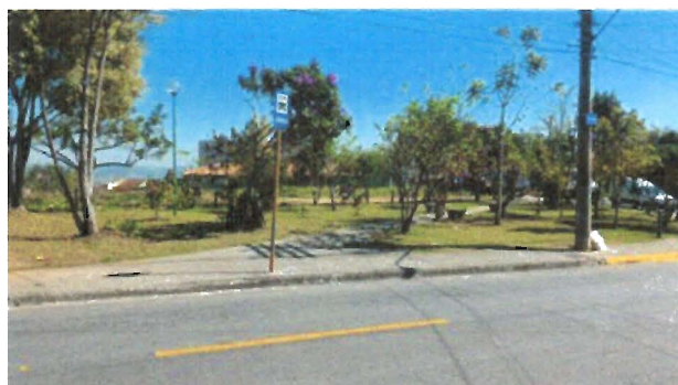
FOTOS: Ponto de ônibus na altura do nº 81 da Rua dos Crisântemos, no Jardim Bela Vista.