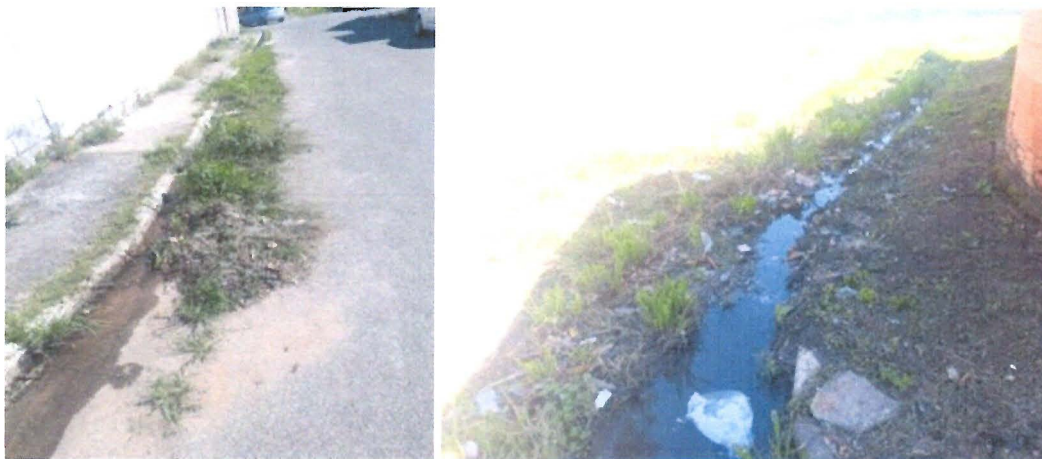
Foto 3 – Capina e limpeza no final da R. Alfredo Seda Lirio de Moraes, próximo ao pasto lá existente.

Fotos 1 e 2 – Capina e limpeza na Travessa entre a Rua Vinte e Oito e a Rua Profa. Dirce Tomas da Silva, com acúmulo de água pluvial que causa mau cheiro.