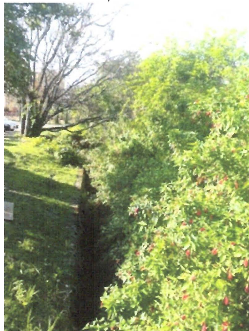
Foto 3: Capina e limpeza na Rua Vicente Ítalo Feola, ao lado nº 292