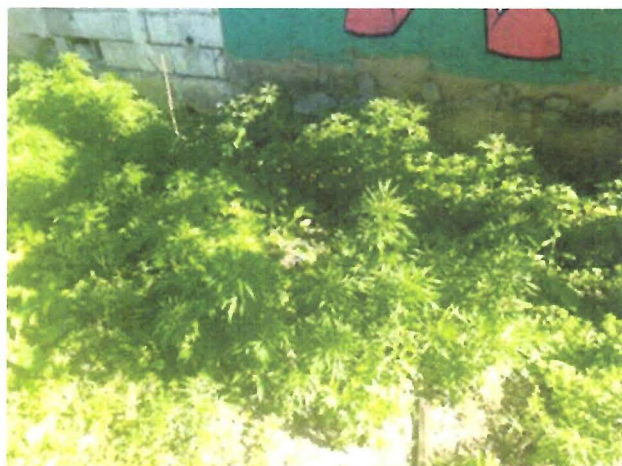
FOTOS 1 E 2: Capina e limpeza da viela ao lado Rua Bertioga (mato e entulho).