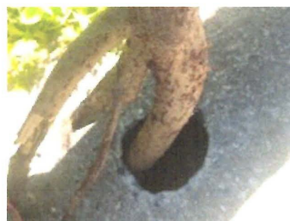
FOTOS 7, 8 E 9: Bueiro quebrado e buraco fundo na calçada da viela ao lado da Rua Bertioga.