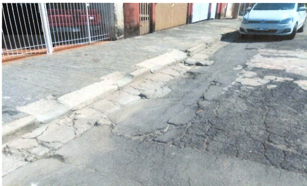
Figura 2 - operação tapa-buraco