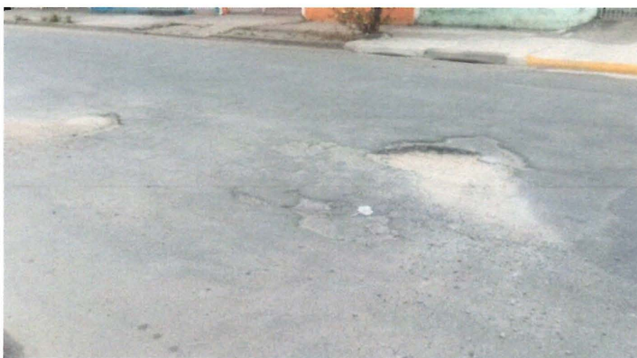
Figura 2 operação tapa-buraco