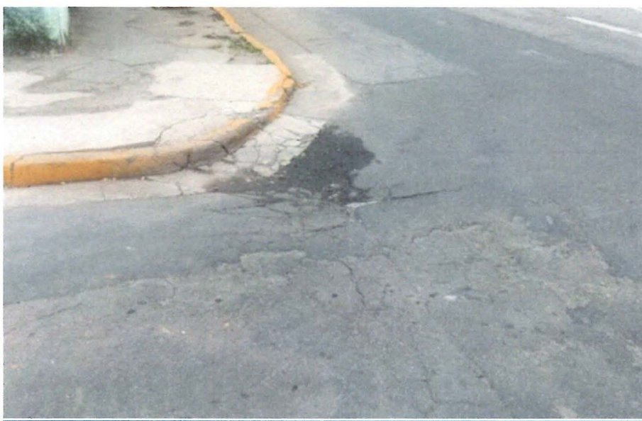
Figura 3 operação tapa-buraco