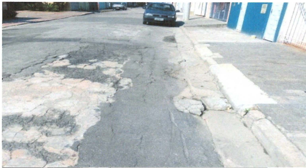
Figura 1 - operação tapa-buraco

Indicação nº 1937/2019 – Vereadora Sônia Regina Gonçalves - fls. 2/2