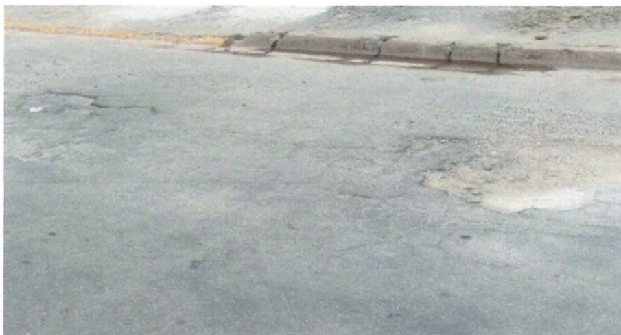
Figura 1 operação tapa-buraco

Indicação nº 1941/2019 – Vereadora Sônia Regina Gonçalves - fls. 2/2