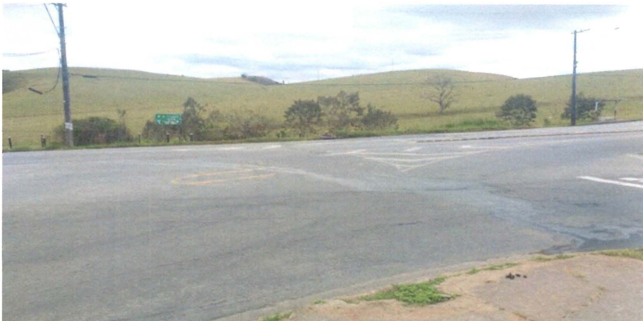
Figura 1 - redutor de velocidade

Requerimento nº 300/2019 – Vereadora Sônia Regina Gonçalves - fls. 2/2