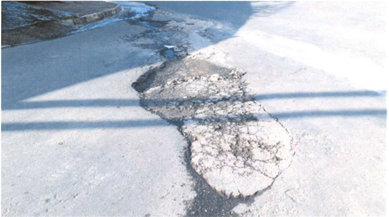
FOTO: Região de confluência entre as Ruas Oswaldo Barrios Miguelis e Moisés Ribeiro da Silva, na Vila São João, no Distrito de São Silvestre.

Indicação nº 1898/2019 - ARILDO BATISTA - fls. 2/2