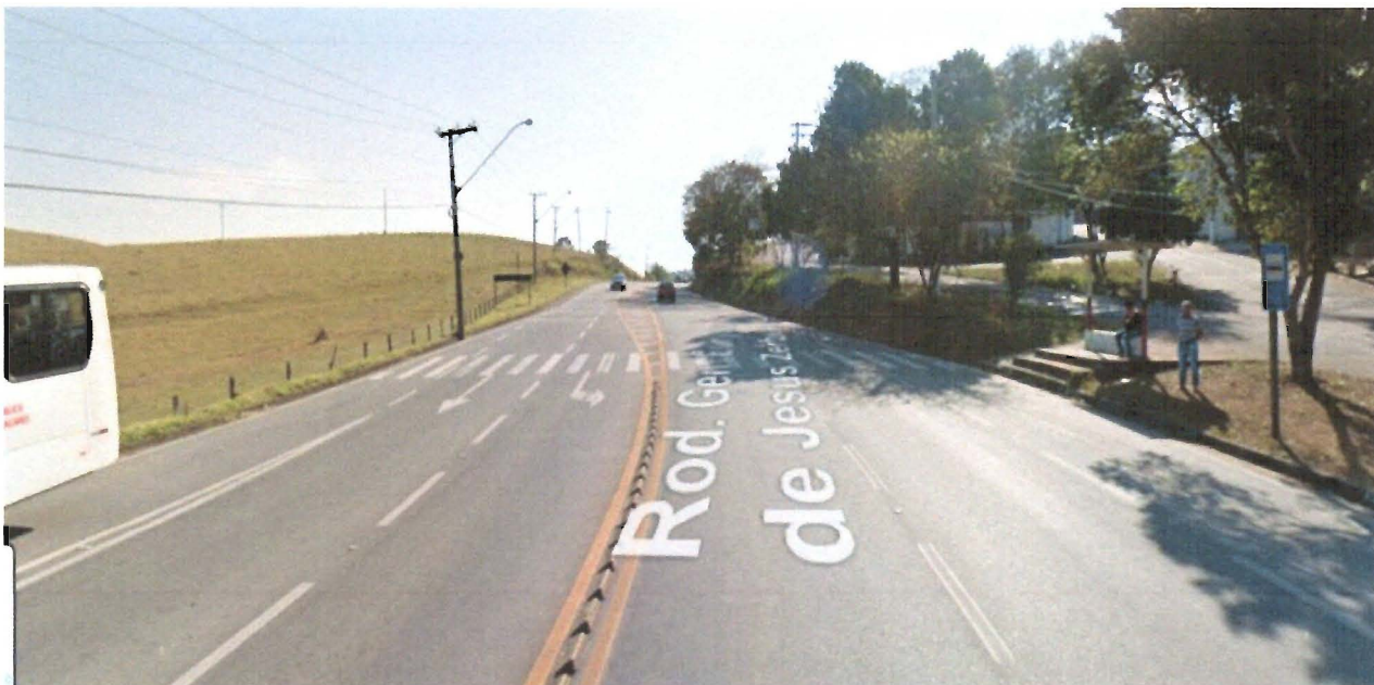
Figura 2 - redutor de velocidade