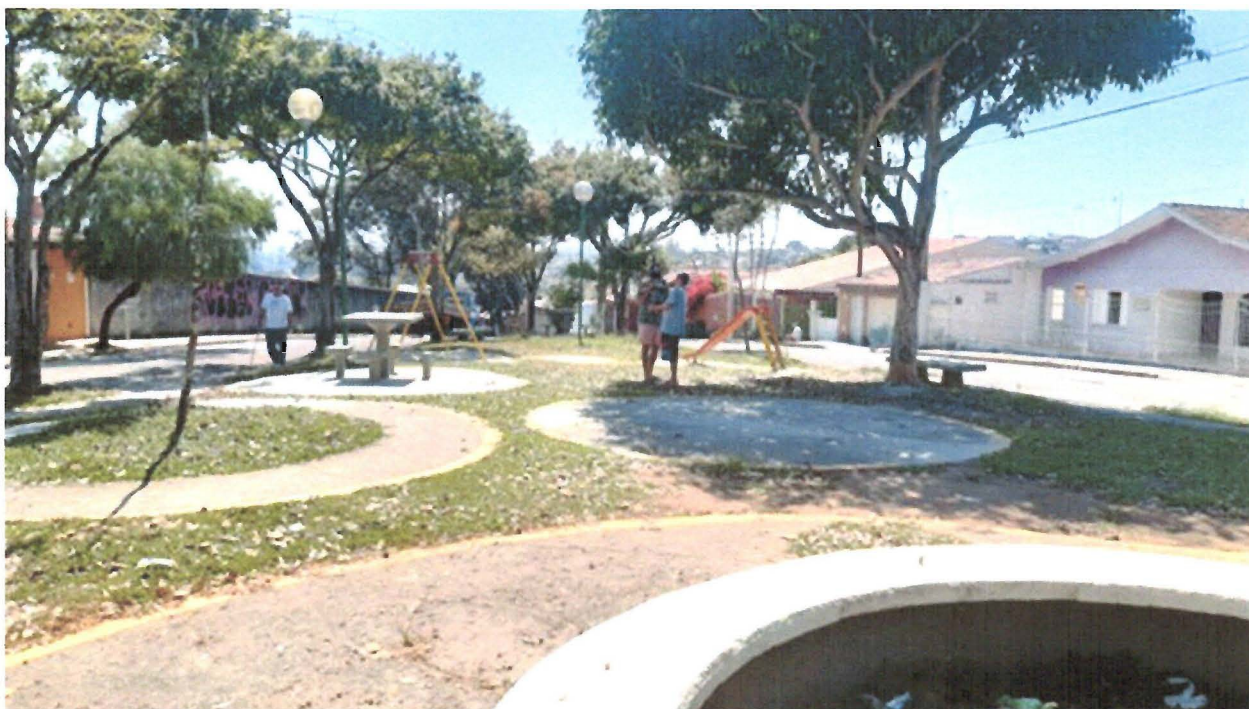
FOTO: Área de lazer e esporte localizada na Rua Aurora, na Vila Formosa.

Indicação nº 1930/2019 - PAULINHO DO ESPORTE - fls. 2/2