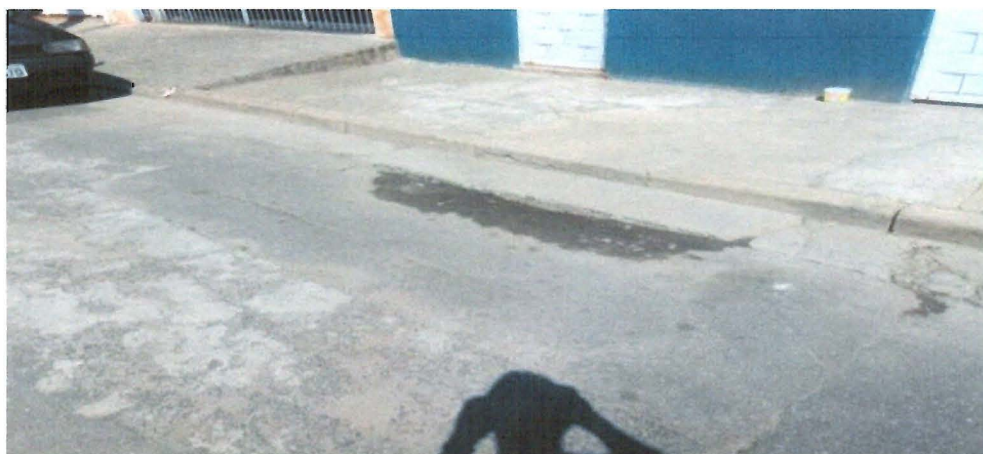
Figura 3 - manutenção asfáltica