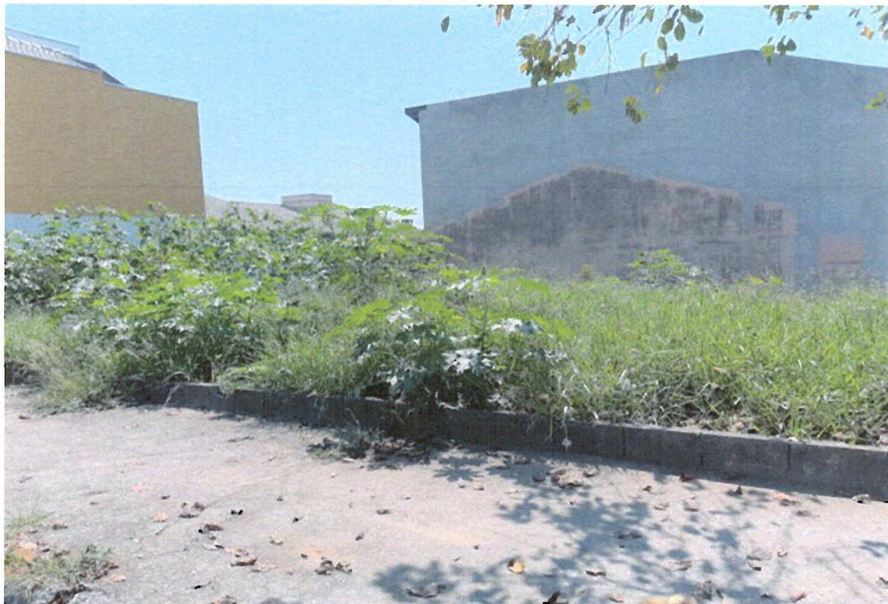
FOTO: Terreno localizado defronte do nº 362 da Rua José Conceição Barreiros, no Residencial Santa Paula.

Indicação nº 2084/2019 - SÔNIA REGINA GONÇALVES - fls. 2/2