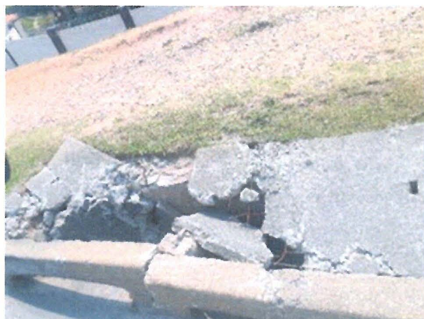
FOTO 2 Troca de Tampas de Bueiros