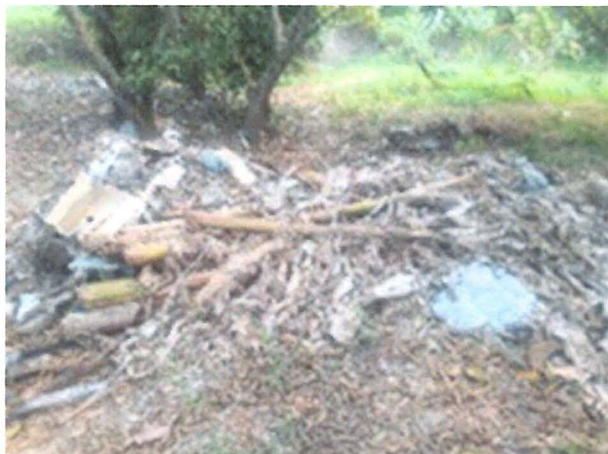
FOTO 1 Remover Entulho