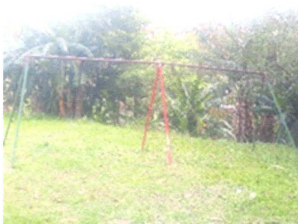
FOTO 2 Manutenção dos Brinquedos