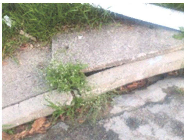
FOTO 3 Troca de Tampas de Bueiros