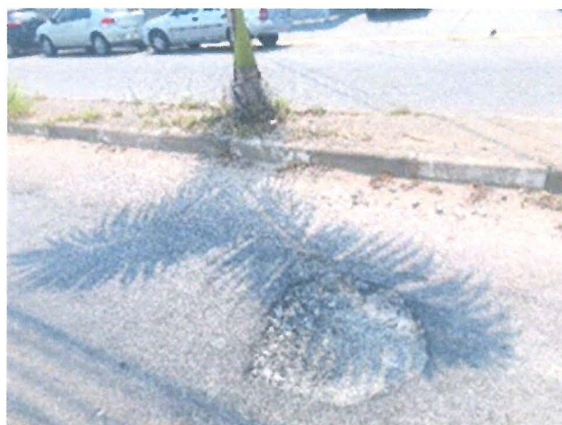
FOTOS 3 E 4 Operação Tapa-Buracos