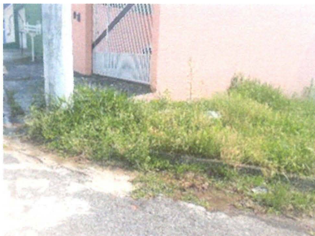
FOTO 1 Capina e Limpeza