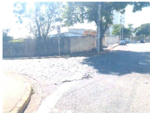
Necessidade de pintura de faixa de pedestres e sinalização horizontal