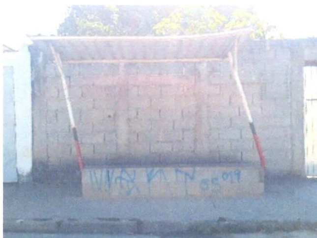
Manutenção de ponto de ônibus