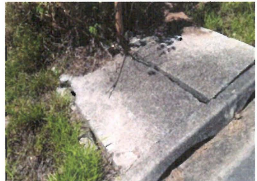
Tampa de bueiro quebrada