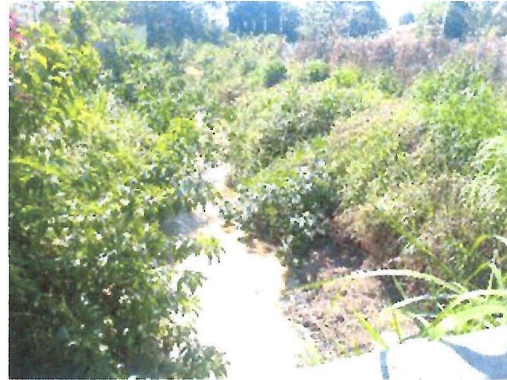
Limpeza no córrego