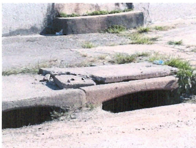
Troca de tampa de bueiro