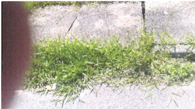
Bueiro tampado na R. José G. Filho