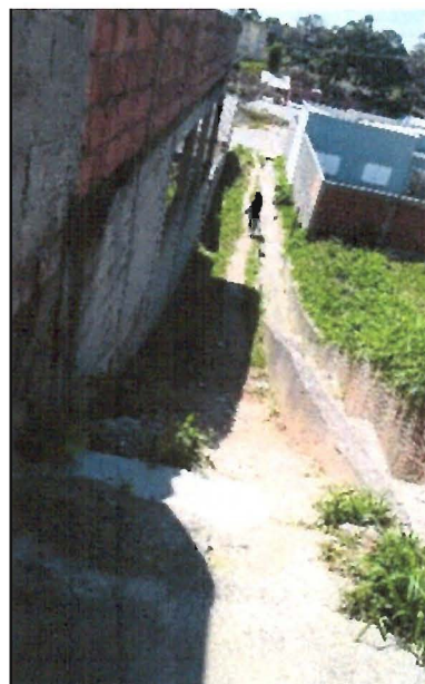
Escada para Viela