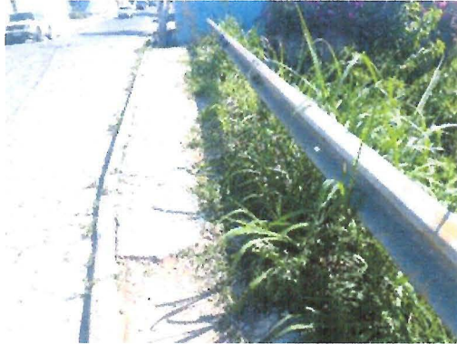
Capina e limpeza

Indicação nº 2263/2019 - LUCIMAR PONCIANO - fls. 2/2