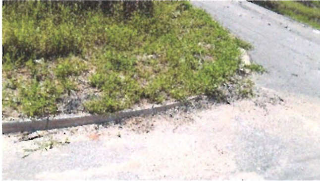
Capina e limpeza

Indicação nº 2266/2019 – Vereadora Lucimar Ponciano - fls. 2/2