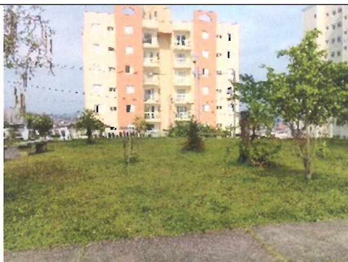
Brinquedos nesta Praça