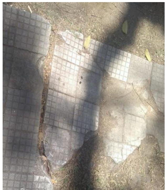
FOTOS: Calçadas da Avenida Major Acácio Ferreira.