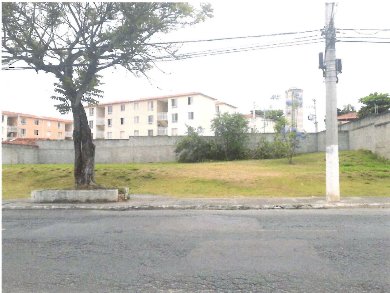
FOTO: Terreno localizado no nº 370 da Avenida Moriaki Ueno, no Bairro Cidade Jardim.

Indicação nº 2516/2019 - SÔNIA REGINA GONÇALVES - fls. 2/2