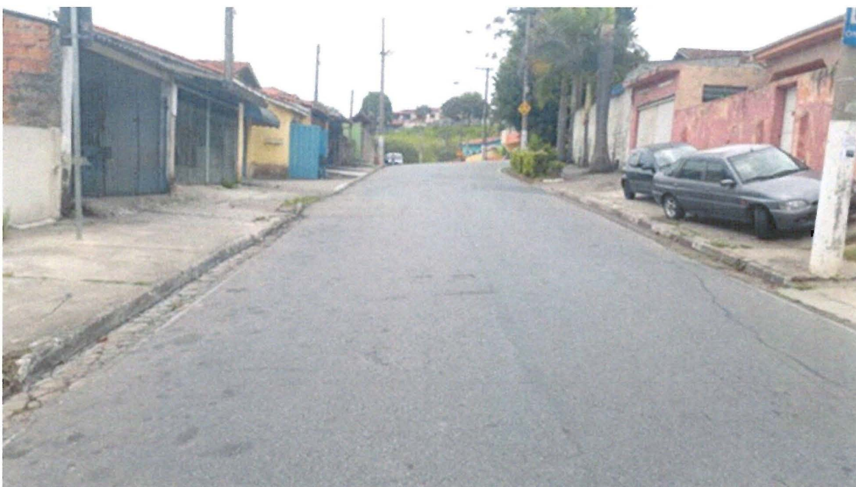
FOTOS: Rua São Jerônimo, no Jardim das Indústrias.