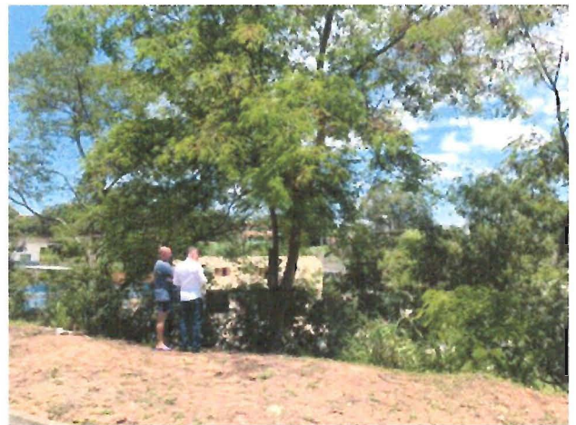
FOTOS: Área pública existente na Rua Finlândia, no Jardim Colônia.