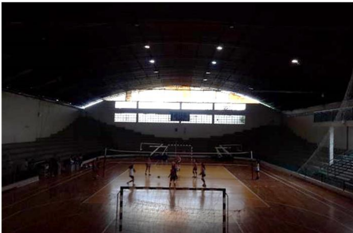
QUADRA SEM ILUMINAÇÃO

Indicação nº 2781/2019 - JUAREZ ARAÚJO - fls. 2/2