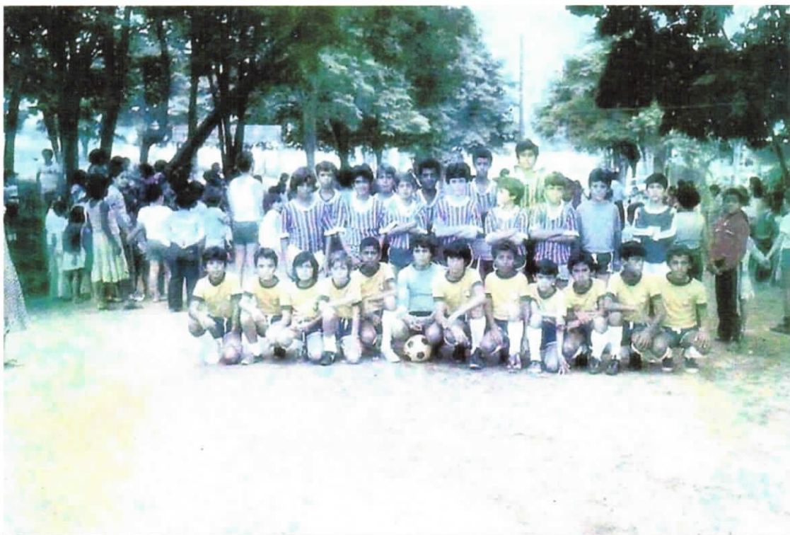
TIME DE LISTRADO - "CATEQUESE" - AMARELO - "DIDINHA"