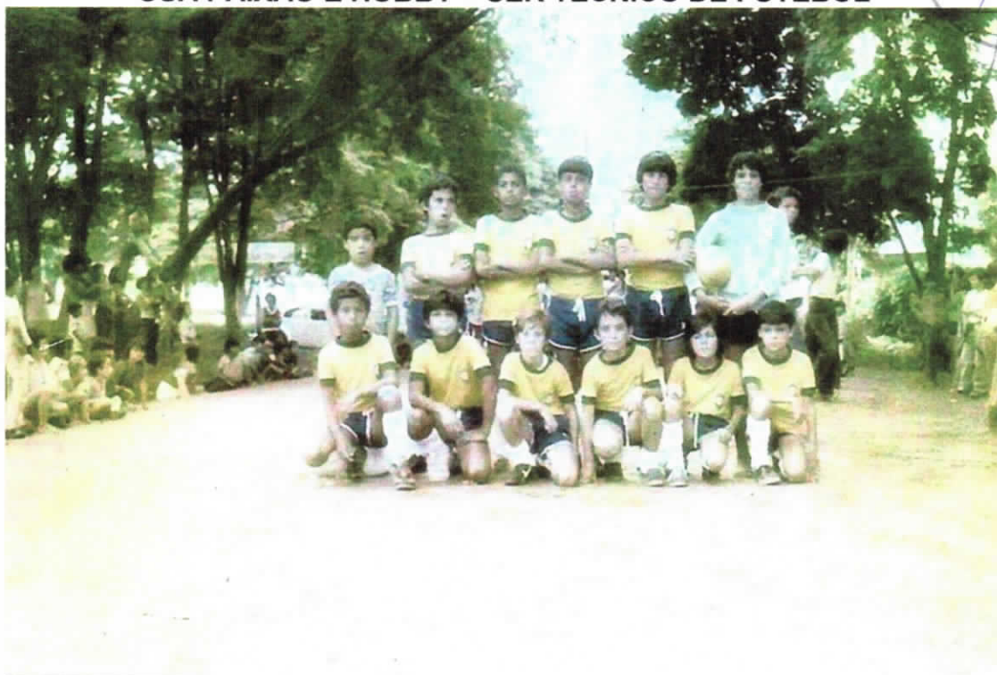
TIME INFANTIL DO JD. DIDINHA

SUA PAIXÃO E HOBBY - SER TÉCNICO DE FUTEBOL