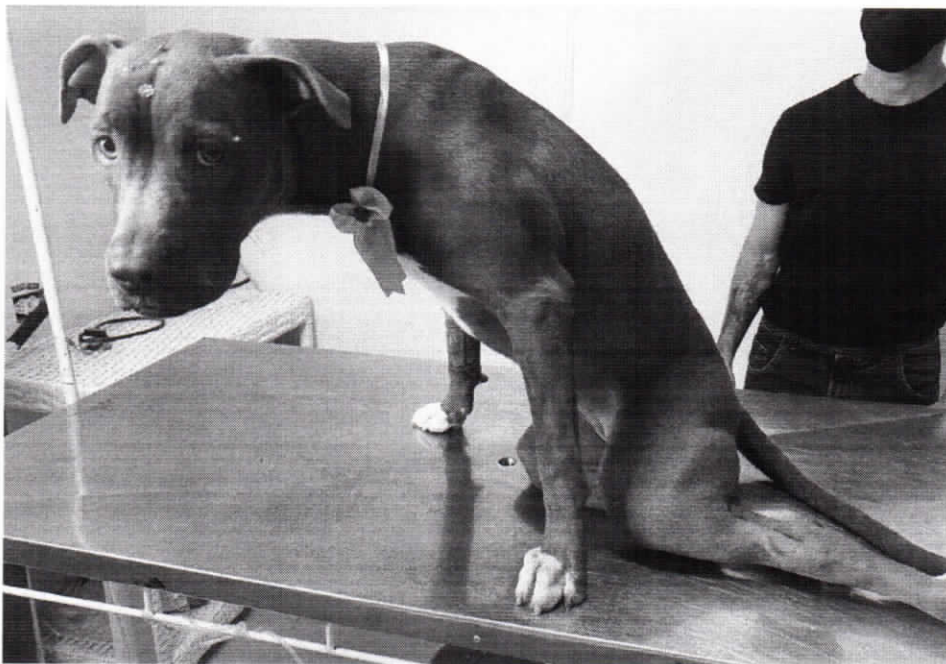
Mel ficou sem o movimento das pernas após cair de sacada em Bertioga, SP

Mel tem apenas 8 meses e já passou por cirurgia. Filhote precisa fazer tratamento com cannabis por correr o risco de ficar paraplégica.