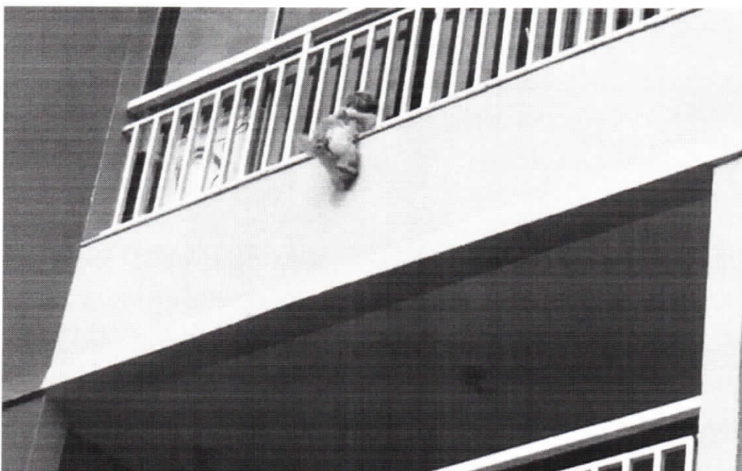
Cadela cai da sacada de prédio em Goiânia

Quando a cadela foi resgata, todos comemoraram. Em seguida, uma moradora pegou o animal no colo para acalmá-lo. “Ela está com o coração batendo acelerado”, diz no vídeo.