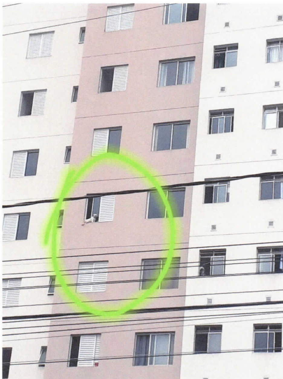
Caso aconteceu no dia 21/11/2021, na Avenida das Letras, Vila Branca em Jacareí, por volta das 10h55min.