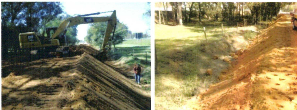
Fotos 01 e 02 – Atividade de Terraplenagem – km 160+000m Pista Sul.

Sobre o assunto, cumpre-nos informar, que a atividade de terraplenagem e drenagem, apesar de fora da faixa de domínio, poderá trazer impactos a faixa de domínio da Rodovia Presidente Dutra, e consequentemente a operação rodoviária, podendo acarretar risco aos seus usuários da rodovia.