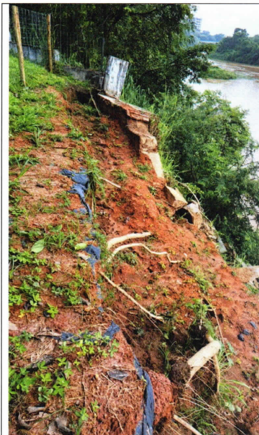
Foto 03 - Vista detalhada do carreamento de material, em função do colapso do muro de contenção;