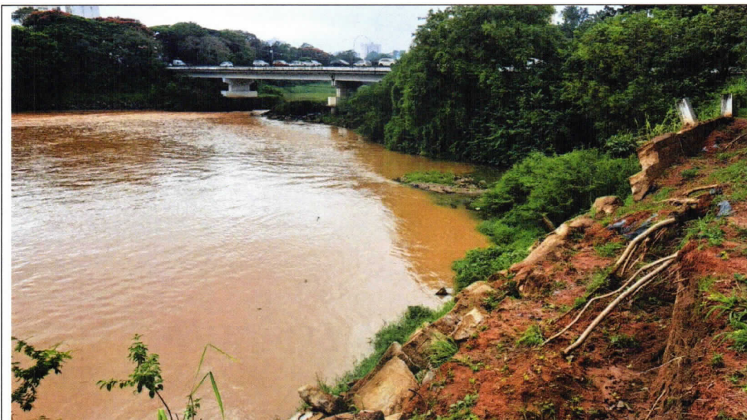
Foto 01 – Vista geral do muro colapsado as margens do Rio Paraíba do Sul;