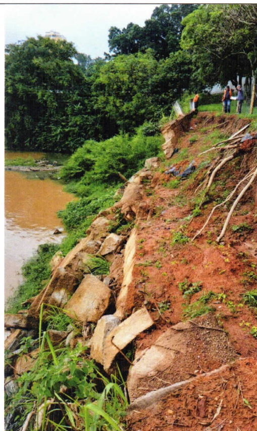
FOTO 04 – Vista detalhada do carreamento de material e exposição de raízes de indivíduos arbóreos;