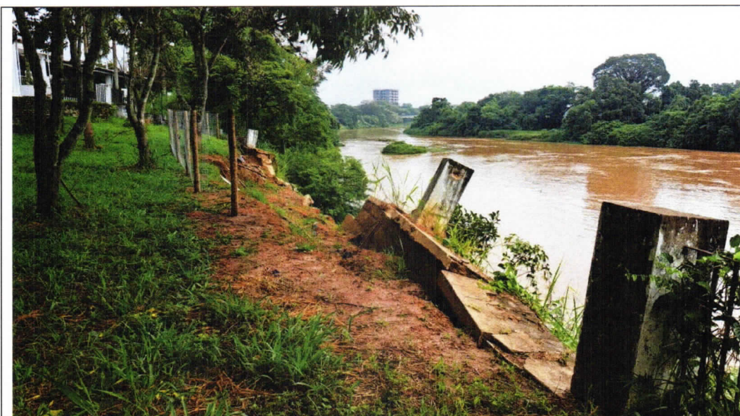
Foto 02 – Vista geral do muro colapsado as margens do Rio Paraíba do Sul;