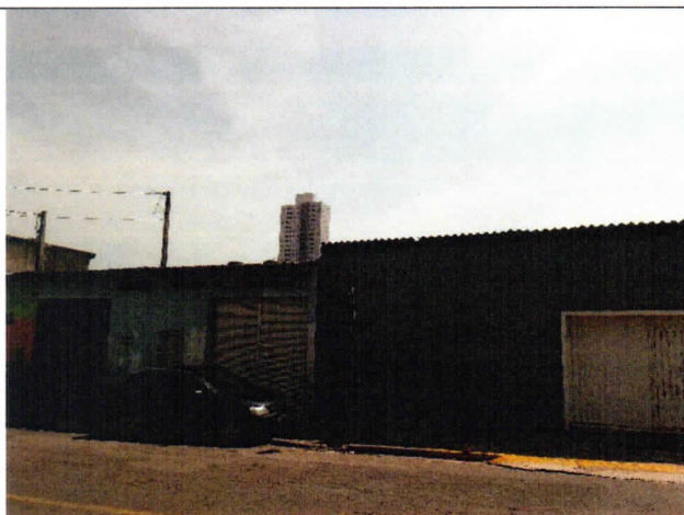
Foto 2. Na divisa do lado esquerdo há guia rebaixada, além da presença de placa de trânsito.