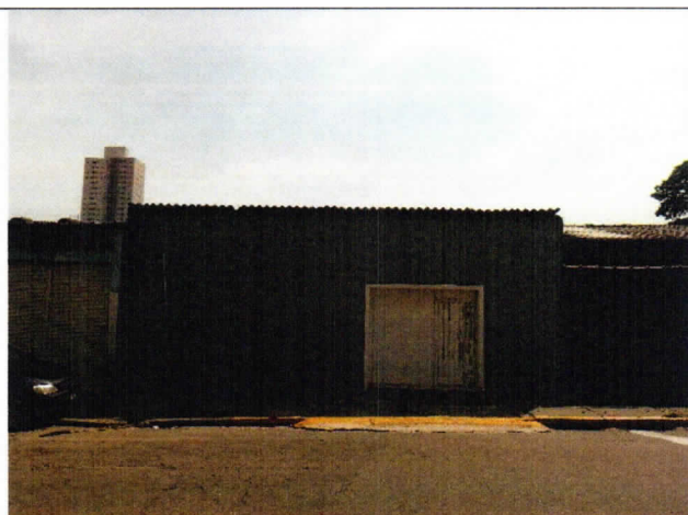
Foto 1. Vista frontal da calçada do imóvel da interessada.