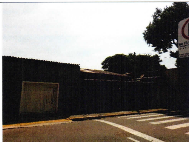
Foto 3. Presença de caixa de sistema drenagem no lado direito.