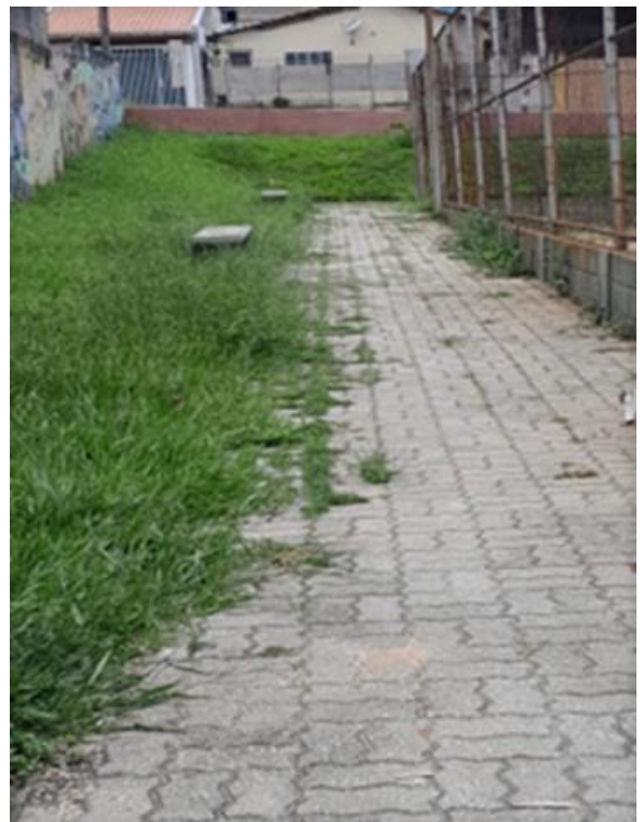
Fotos 3 e 4: Praça da Rua Expedicionário Paulo de Oliveira Branco, próximo ao nº 161, no Jardim das Indústrias