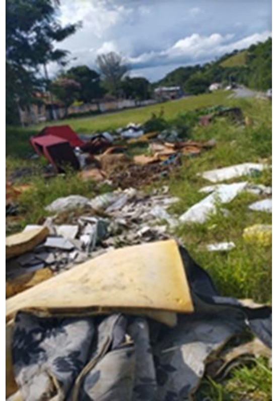
Fotos 1 e 2: Canteiro central da Estrada Theóphilo Theodoro de Rezende, no Bairro Campo Grande