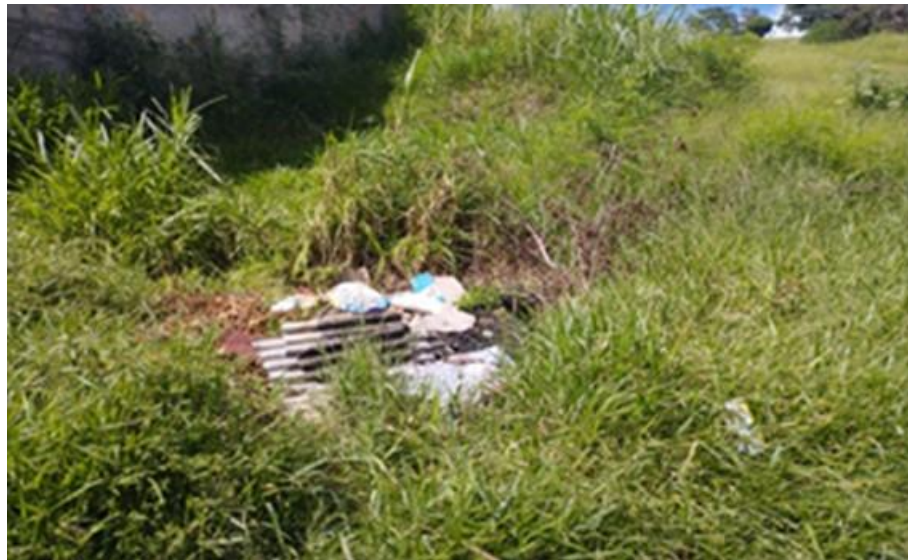
Foto 7: Rua Lourenço Nogueira, ao lado do nº 294, no Jardim Paraíso