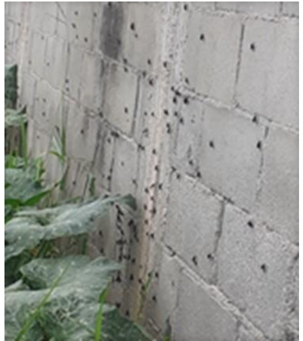
Fotos 5 e 6: Rua João Eduardo Rodrigues da Silva, próximo ao nº 51, na Vila Romana