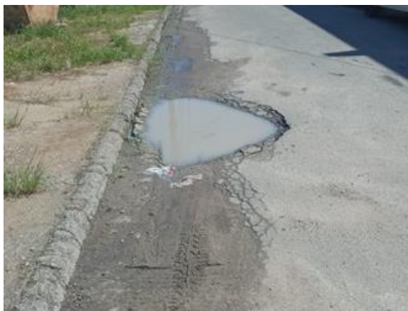
FOTO 1. Defronte do nº 41 da Rua Expedicionário Américo Pereira da Silva, Parque dos Sinos.

INDICAMOS ao Excelentíssimo Senhor Prefeito Municipal de Jacareí que sejam tomadas providências cabíveis visando à realização de reparo asfáltico defronte do nº 41 da Rua Expedicionário Américo Pereira da Silva, no Parque dos Sinos; defronte do nº 739 da Rua dos Ibiscos, no Parque Santo Antonio; e próximo ao nº 334 da Rua Imaculada Conceição, no Jardim Bela Vista.