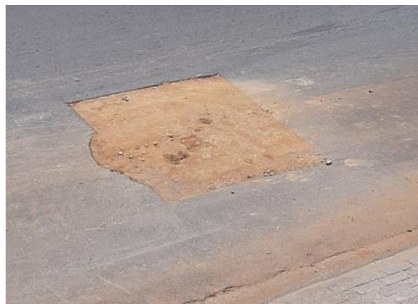
FOTO 2. Defronte do nº 739 da Rua dos Ibiscos, Parque Santo Antonio.