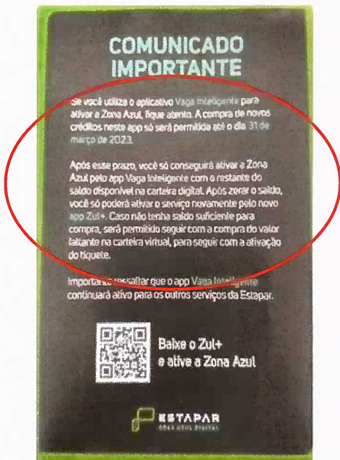
Panfleto - Comunicado compra de crédito