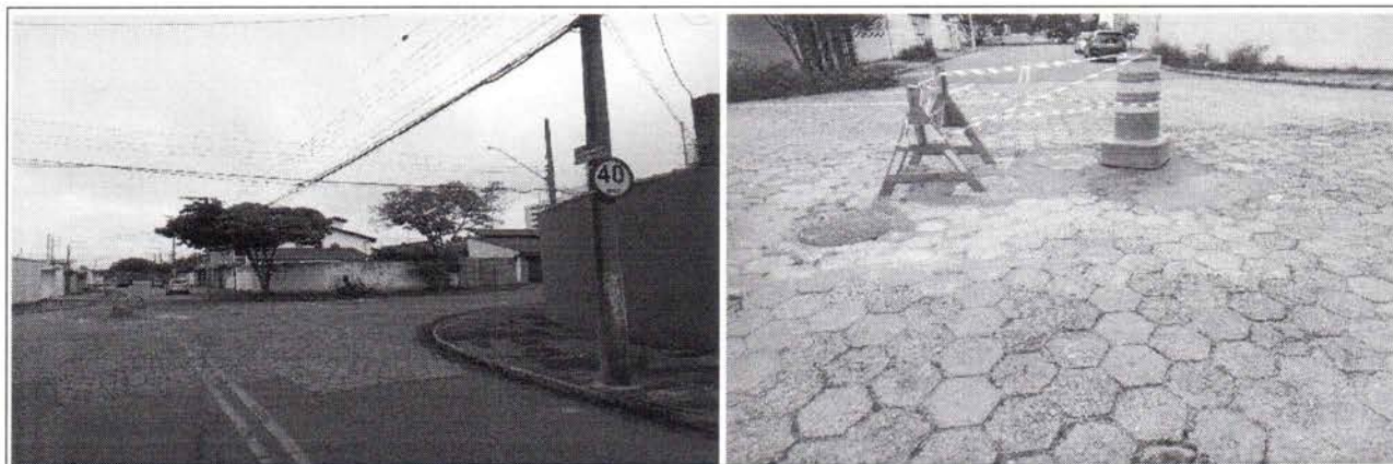
Foto 1 e 2: Av. Azênio de Azevedo Chaves eq. Rua Maria Aparecida do Prado, Jardim Santa Maria

Em resposta à Indicação n.º1916/2023, de vossa lavra, informamos que foi recomposta a pavimentação de bloquetes de concreto sextavados, na Av. Azênio de Azevedo Chaves eq. Rua Maria Aparecida do Prado, Jardim Santa Maria, através da OS 2022/6543, serviços finalizados em 10/05/2023.