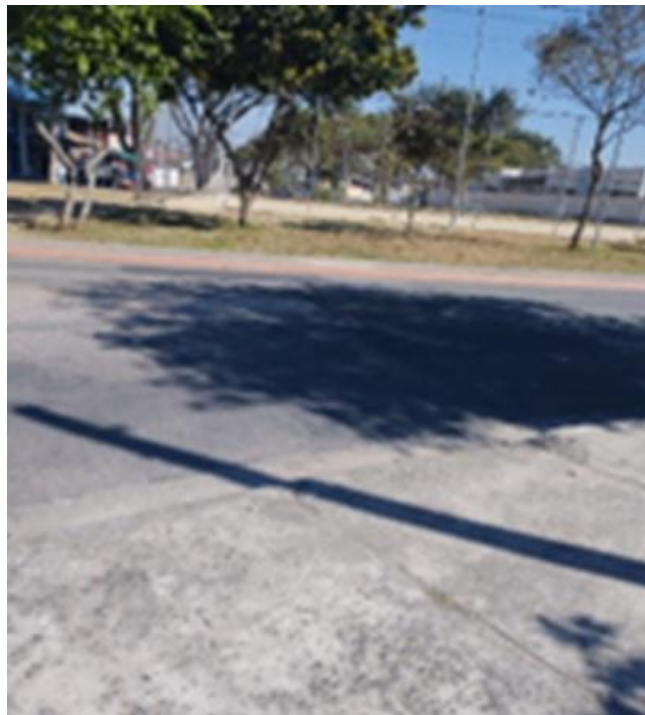
Foto 2: Rua Dom João II, defronte do nº 505, no Parque dos Príncipes