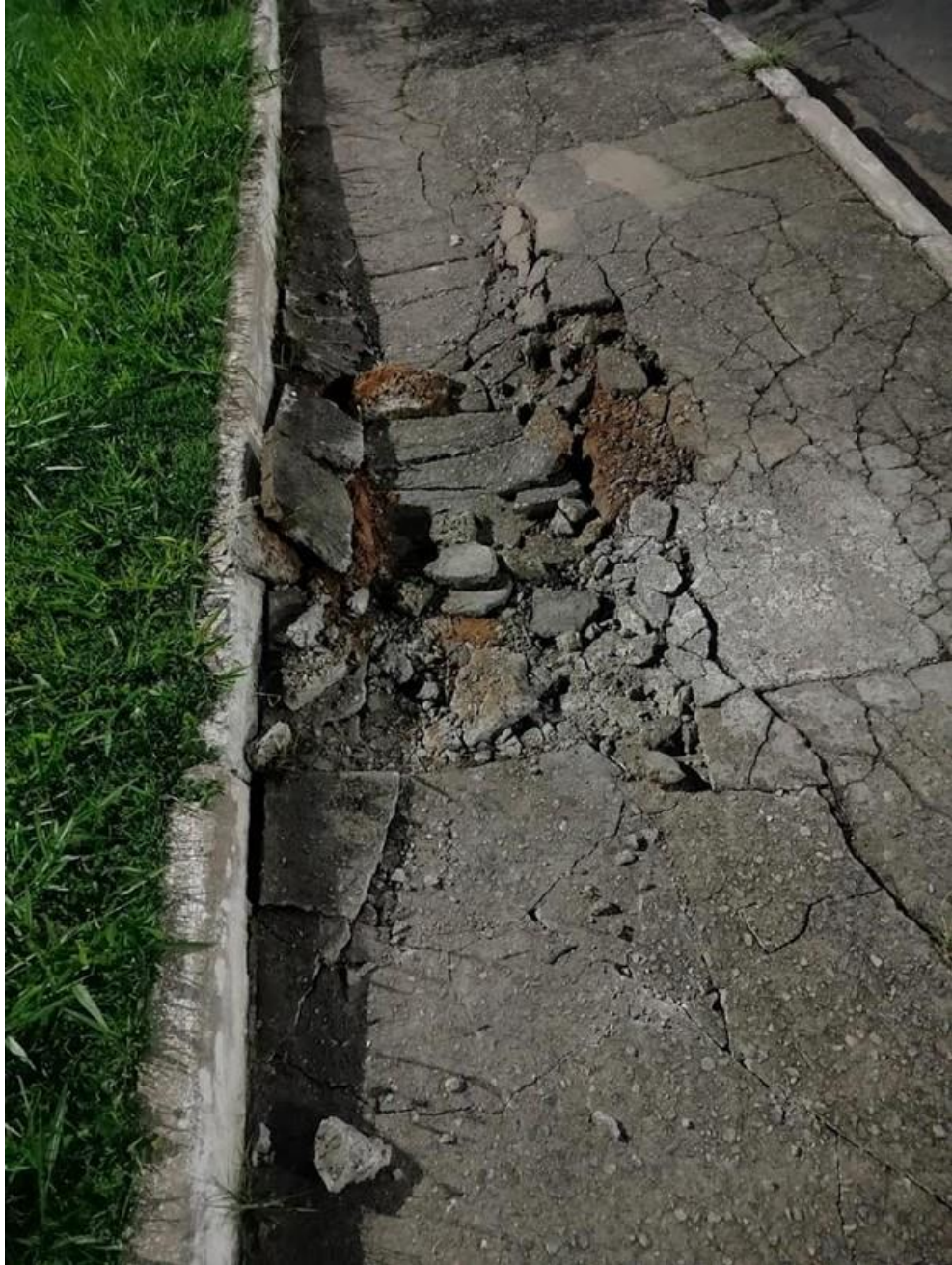
Foto 5: Avenida Pensylvânia, nº 71, em frente à Padaria Pontual, no Jardim Marister

Indicação nº 4258/2023 - Vereador Dr. Rodrigo Salomon - fls. 3/3