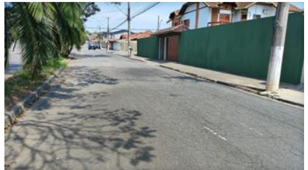
Fotos 3 e 4: Avenida Carlos Frederico Werneck Lacerda, do número 146 ao 188, no Bairro Cidade Jardim