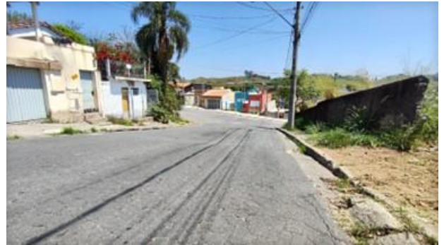
Fotos 1 e 2: Rua Antônio de Oliveira Filho, do número 875 ao 933, no Bairro Cidade Nova Jacareí