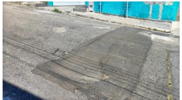
Fotos 5 e 6: Rua Oriente, em frente ao número 95, no Jardim Panorama