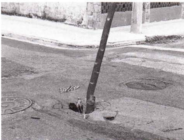
Fotos 9 e 10: Rua Caçapava, em frente ao número 134, no Jardim das Indústrias