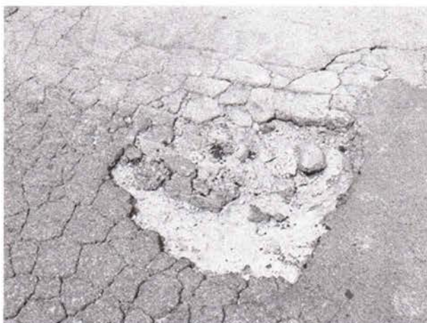
Fotos 3 e 4: Rua Joaquim de Souza, próximo ao nº 120, no Jardim Alvorada