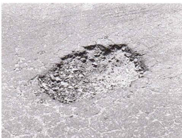
Fotos 5 e 6: Av. Maria Augusta Fagundes Gomes, em frente à UBS, no Residencial São Paulo