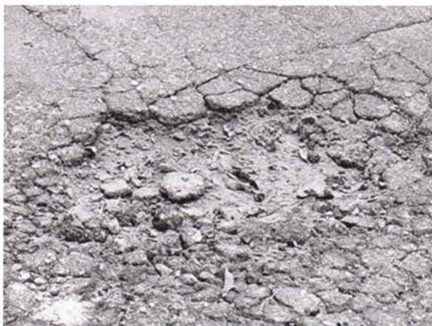
Fotos 3 e 4: Avenida Carlos Fernandes ao lado do número 270, Bairro Terras de São João