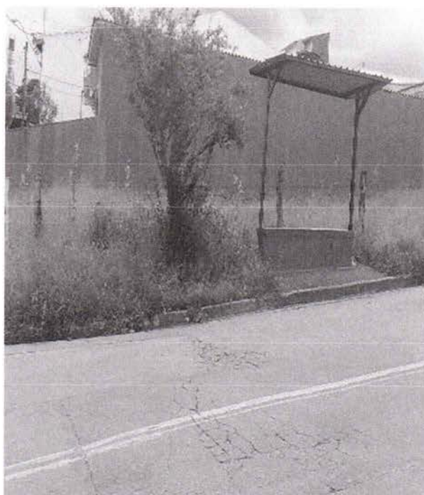
Rua Quinzinho - Joaquim de Souza, esquina com a Rua Jota Domingues, no Portal Alvorada