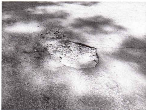
Fotos 1 e 2: Rua Ale Mohamed Ahmed, em frente ao número 165, Bairro Residencial São Paulo