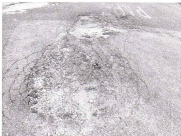
Fotos 7 e 8: Avenida Rodrigo Melo Franco Andrade, em frente ao número 508, Bairro Jardim Nova Esperança