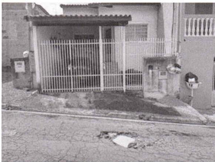
Foto 2: Rua Conchetta Viola Magnani, defronte ao nº 56, no Jardim Santa Marina