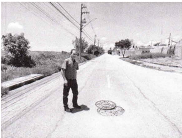
Foto 1: Rua Oristano, defronte ao nº 158, no Residencial Santa Paula

Indicação nº 442/2024 - Vereador Paulinho do Esporte - fls. 2/2