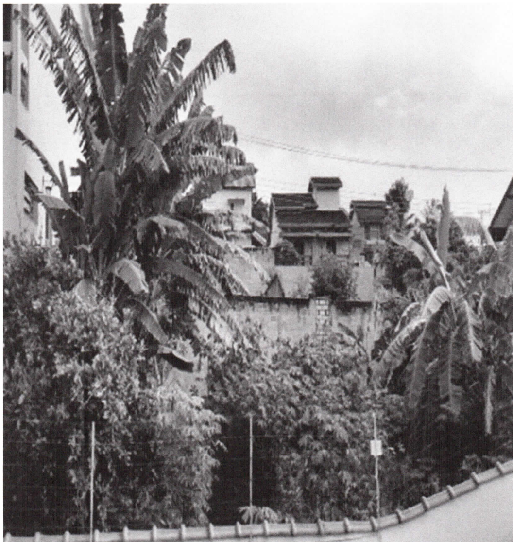
FOTO 1 - Rua Helio D'Ávila, ao lado dos nºs 41 e 81, no Jardim Terras de São João