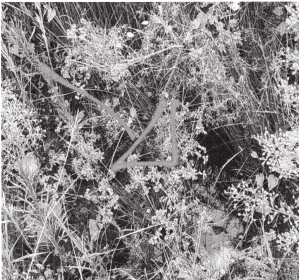
FOTO 2 - Rua Nossa Senhora de Fátima, ao lado do nº 33, no Jardim Bela Vista

Indicação nº 574/2024 – Vereadora Sônia Patas da Amizade – fls. 3/3