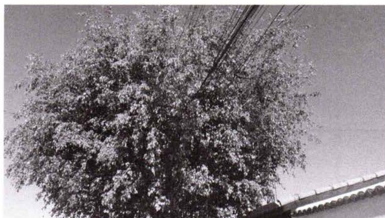
Rua Paraíba do Norte, defronte ao nº 35, na Vila Pinheiro.