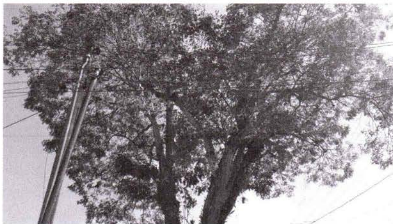
Avenida Amazonas – Jardim Paraíba

Requerimento nº 230/2024 - Vereador Rogério Timóteo - fls. 2/2