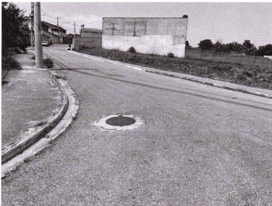
Foto 4- Encontro da Rua Xucuru com a Rua Potiguara