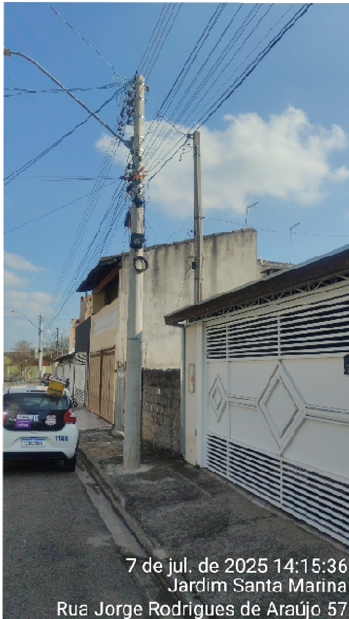
7 de jul. de 2025 14:15:36 Jardim Santa Marina Rua Jorge Rodrigues de Araújo 57