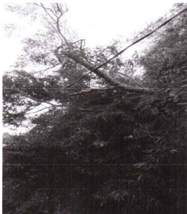
Poda de árvores