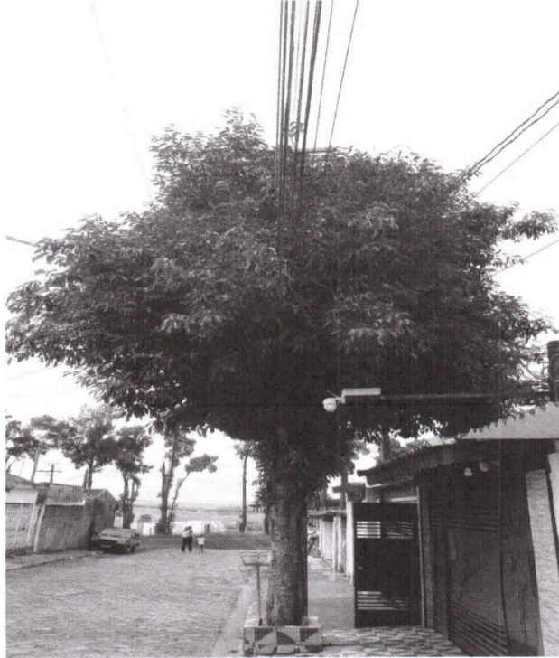
Rua Joaquim Batalha, Parque Meia Lua