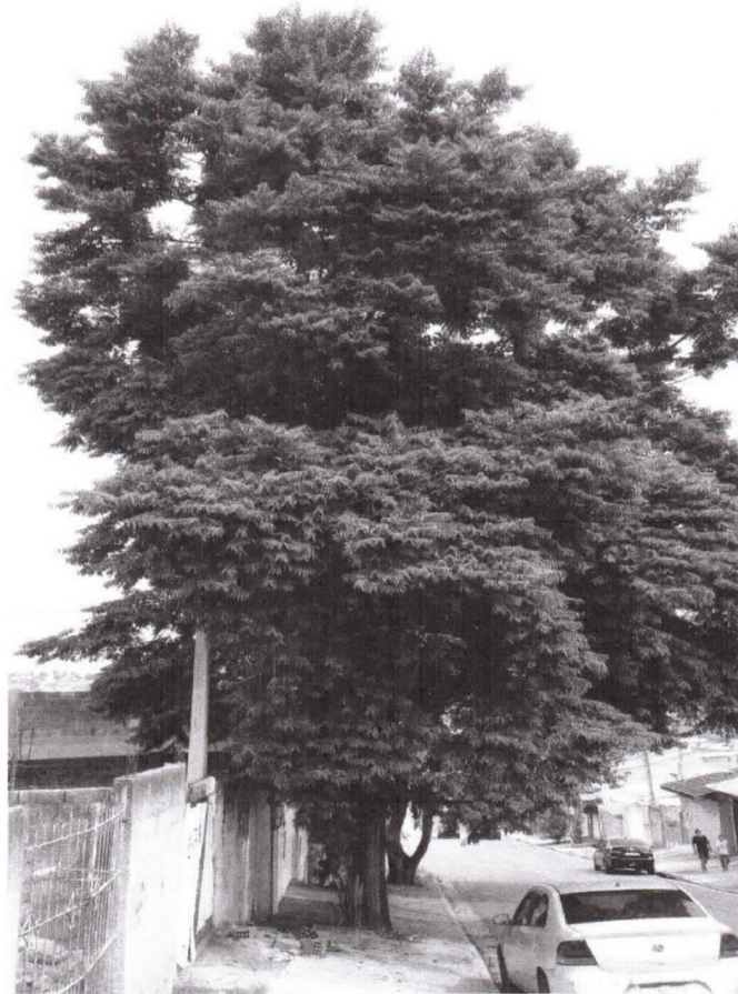
Rua Marquês de Paraná, Jardim do Marquês