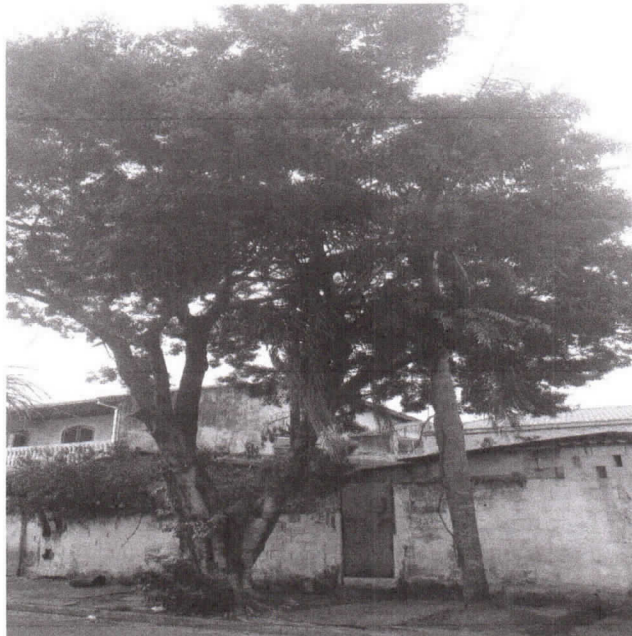
Rua Noel Barreto, Jardim Maria Amélia