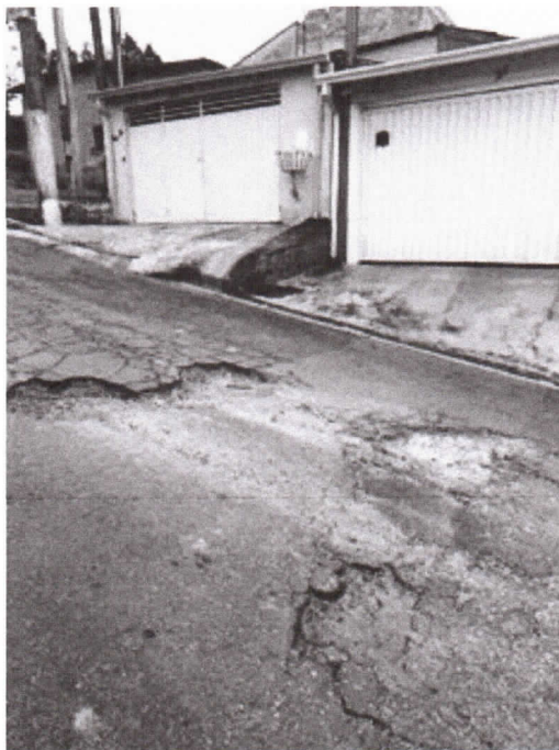
Rua Dra. Zilda Arns, na altura do número 17, Jardim Real

Indicação nº 1930/2025 - Vereador Siufarne do Cidade Salvador - fls. 2/2