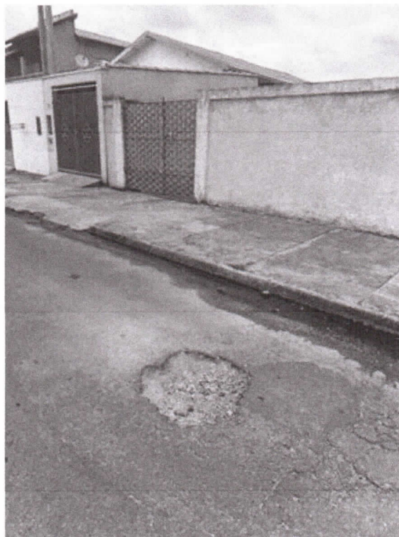
Rua Cruzeiro, na altura do número 36, Cidade Salvador