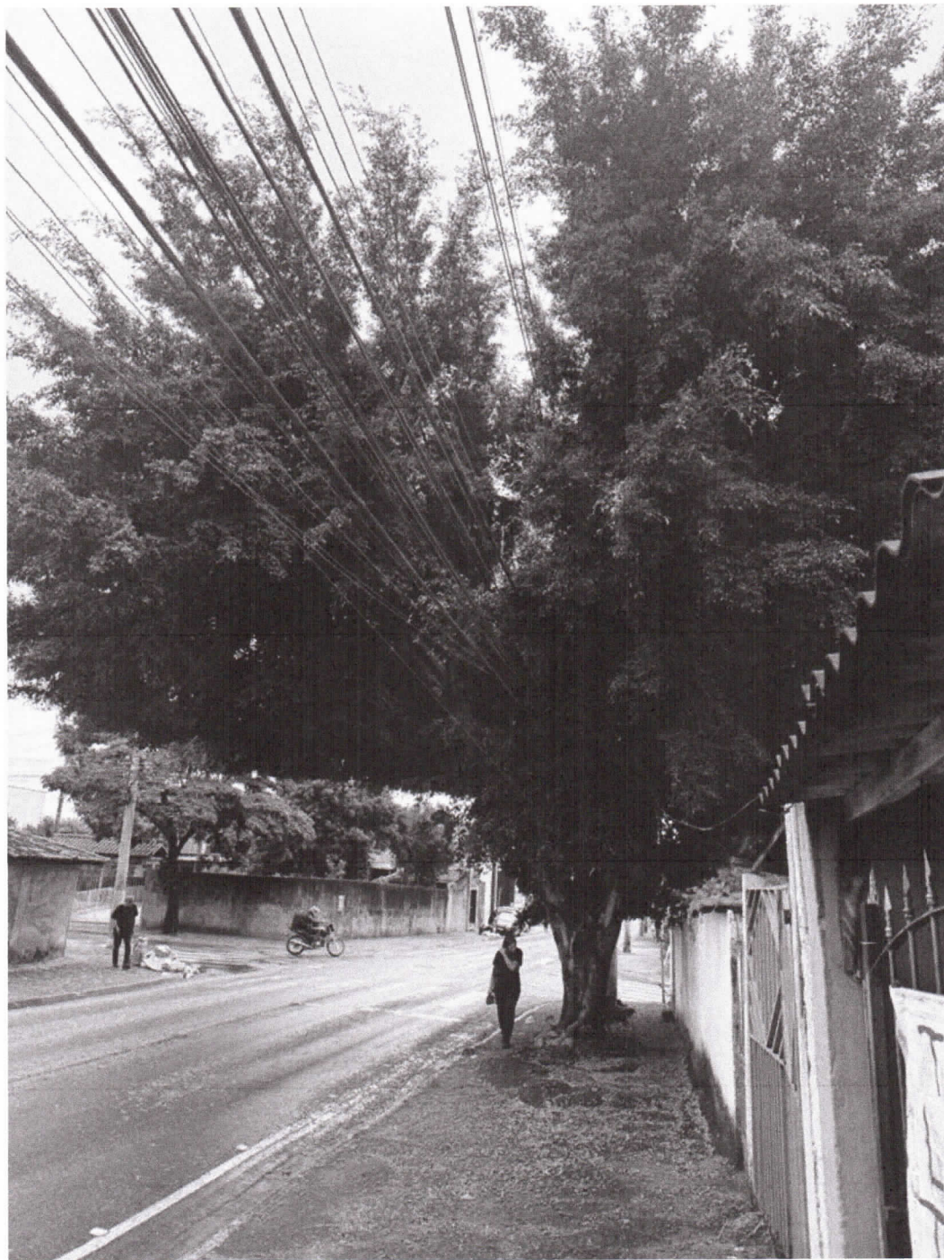
Avenida São Jorge, nº 648, Cidade Salvador.