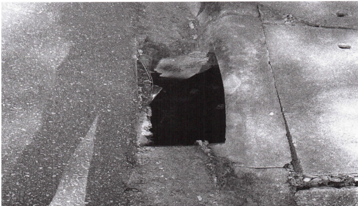
Imagem 1 - danos na BL e possível ausência de grade na boca de leão

Indicação nº 2485/2025 - Vereador Jean Araújo - fls. 2/2