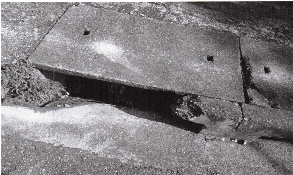
Imagem 2 - danos aparentes na BL