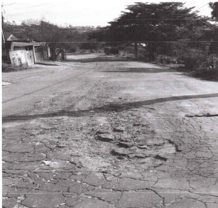
Rua Claudio Gonçalves de Gouveia, em frente aos números 621 e 638