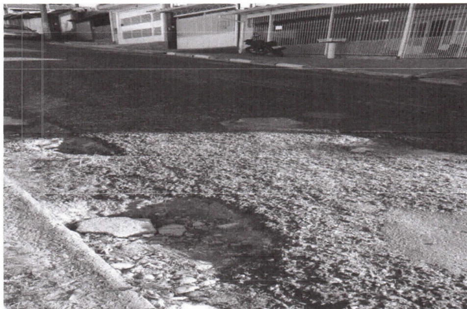
Rua São José, em frente ao número 116