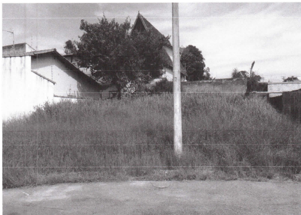
Rua José Coutinho de Oliveira