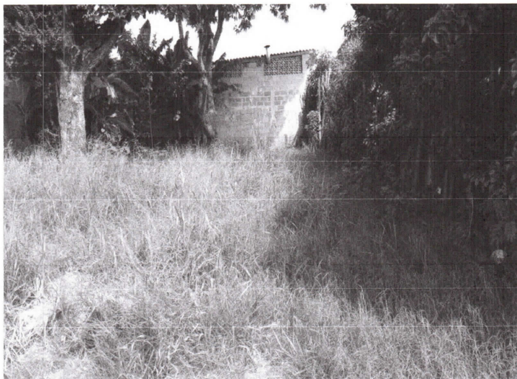
Rua João Domingos Lencioni