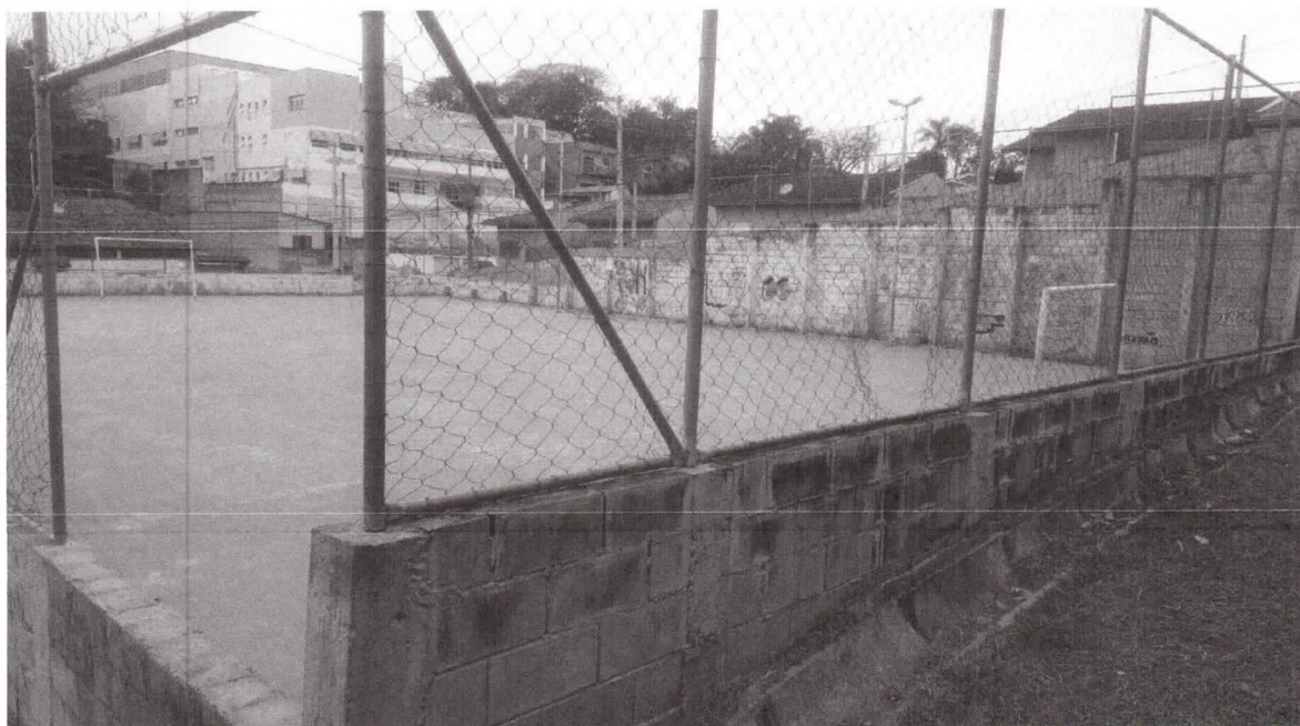
Quadra localizada na Avenida Romulo Rossi, defronte ao nº 710, no Jardim Santo Antônio da Boa Vista