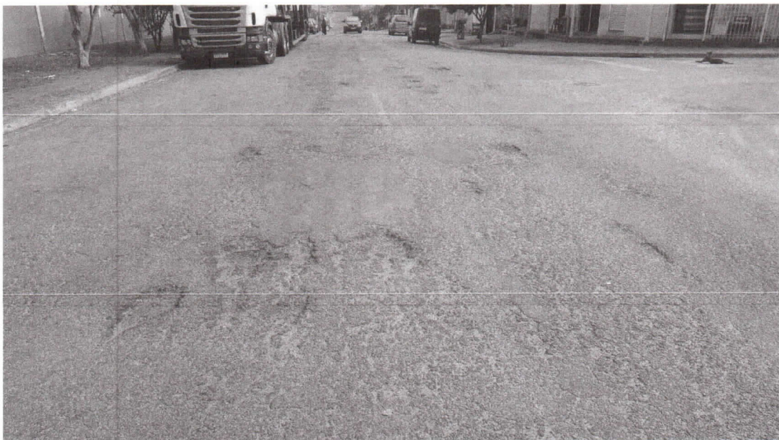
Avenida Dante Siani, no Jardim Santa Marina.