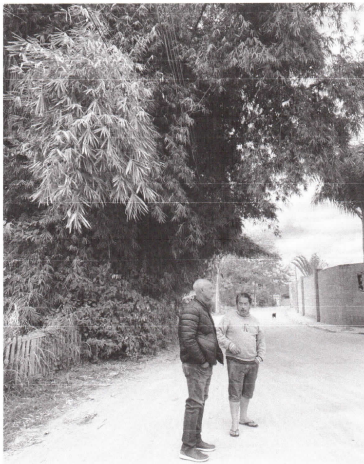
Estrada Júlio Carvalho, em frente ao nº 515 no bairro Cepinho.

Requerimento nº 420/2025 - Vereador Paulinho dos Condutores - fls. 2/2